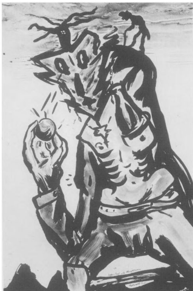
Fred Bervoets, „Zelfportret als kerstboom”, 1985, acryl op papier, 110 x 75 cm.

Daarentegen vormen de monumentale etsen een verademing. Deze prenten werden volgens een onorthodoxe werkwijze rechtstreeks in de plaat geschilderd. Na het afdrukken worden de bladen weer samengevoegd tot een groter geheel en spaarzaam bijgekleurd. In deze werken blijven de „rammelende” overdaad aan smakeloze details en de griezelige al te theatrale anekdotiek ondergeschikt aan de krachtige eenvoud van het medium.