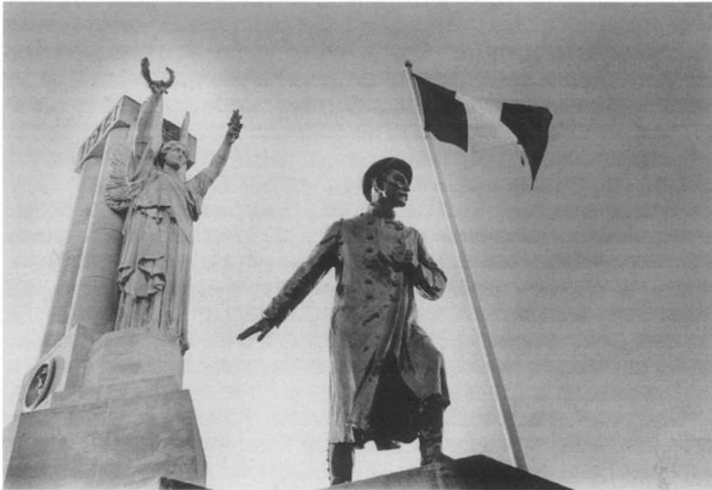
Het monument ter ere van generaal Bardot-Souchez.

heuvel een van de weinige (relatieve) successen van de oorlog behaalde door een methodische voorbereiding, een moderne en efficiënte organisatie en democratische verhoudingen die schril afstaken bij de arrogantie van het oude moederland. Stafofficieren bezochten het front, manschappen werden ingelicht over plannen en strategie. Natuurlijk werd er gesneuveld, maar niet ten koste van nalatigheid. Jonge en frisse Canadese studenten staan in Vimy klaar om op al je vragen antwoord te geven, je te gidsen door de onderaardse gangen die de Hugonoten al gebruikten en waarin de Canadezen hun toevlucht zochten.