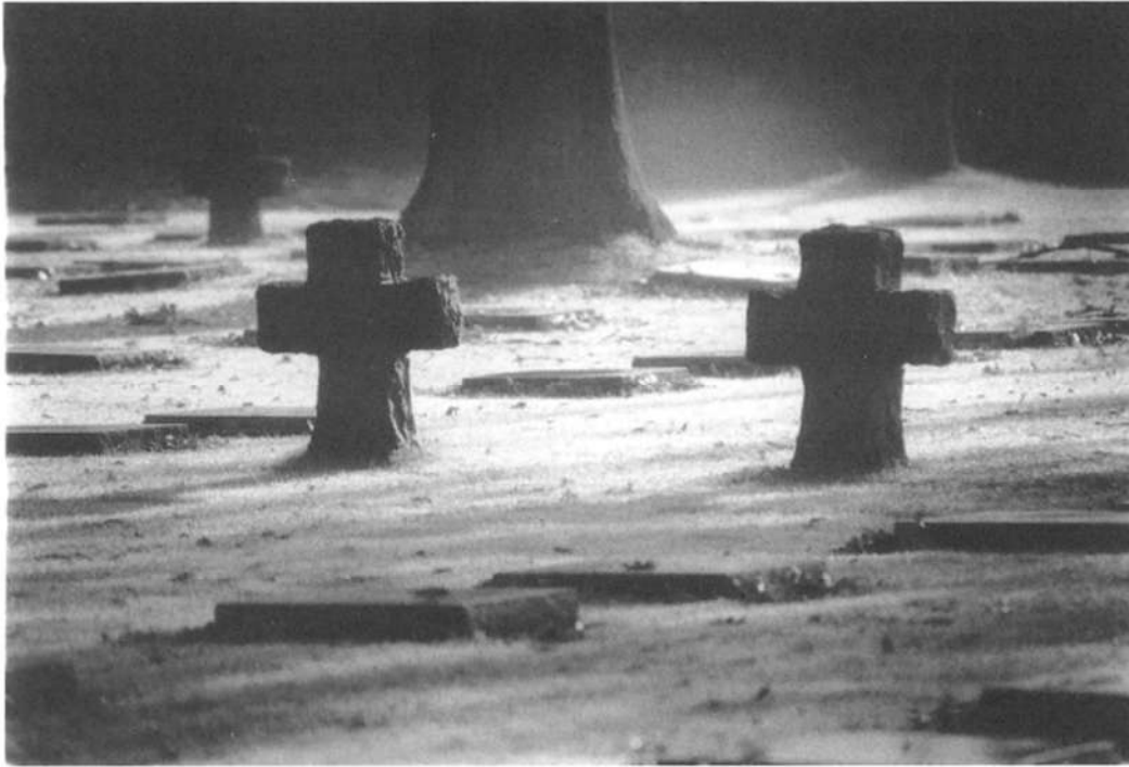
Duits militair kerkhof - Menen