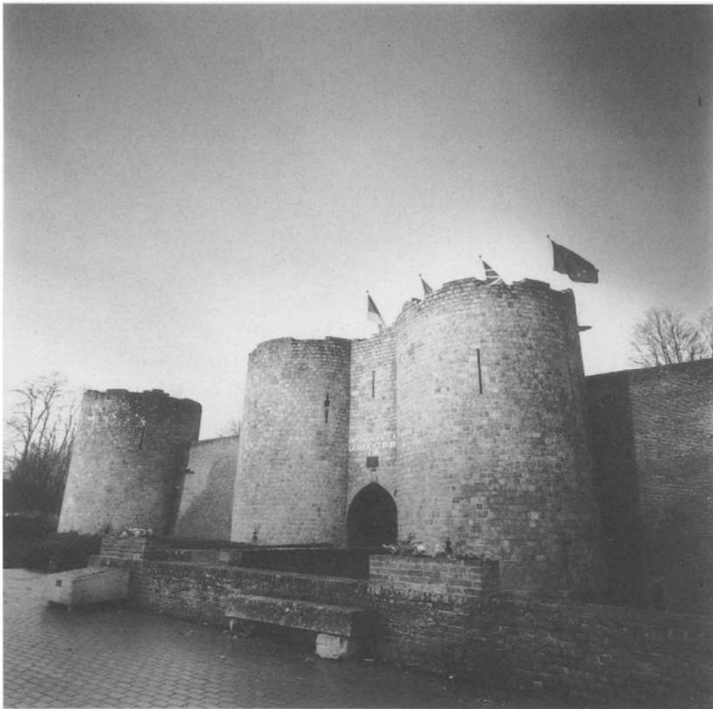
Historial de la Grande Guerre - Péronne

moet een hek opendoen en een weide oversteken om het, achter een boerderij, te vinden. Je telt er een tachtig Noord-Ierse graven in wat ooit niemandsland was. Aan de andere kant van de weg ligt Lone Tree Crater waar ooit de Spanbroekmolen stond, nu omgedoopt tot Pool of Peace: het is nauwelijks te geloven dat deze vredige vijver ontstaan is bij één van de gigantische mijnontploffingen die op 7 juni 1917 de derde slag bij Ieper inleidden. Er wordt verteld dat de glazen inktpotjes op het bureau van premier Lloyd George in Londen rinkelden. In Cassel brak generaal Plumer in tranen uit. Het is pas na mijn bezoek dat ik de twee sites met elkaar kon verbinden: de tachtig graven dragen namelijk dezelfde datum als de explosie (7 juni 1917). De Spanbroekmolen ontplofte iets