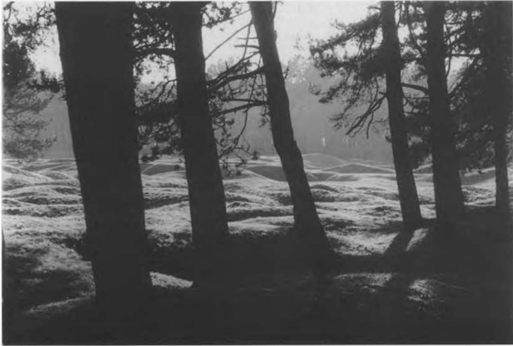
Canadian National Vimy Memorial - Monument commémoratif du Canada te Vimy. Het park met de bomkraters. Voor elke gesneuvelde en nooit teruggevonden Canadese soldaat werd een boom geplant

met donkere steen. De zerken liggen languit in het gras en hun verweerde inscripties bedekken groepen doden. Er wordt spaarzaam omgesprongen met andere bouwelementen of ornamenten: de treurende ouders van Käthe Kollwitz in Vladslo; een achthoekig gebouw in het midden van het kerkhof in Menen dat lijkt op een Romaanse doopkapel; gestileerde bunkers in Langemark. De rationalisering van de kerkhoven heeft hun beeldvorming gewijzigd. De groep, het getal overheerst nu het individu. De nederlaag is er tastbaar geworden in de anonieme gelijkschakeling van de doden. De bomen zorgen voor schaduw (die op haar beurt weer voor mos op de stenen en verweerde inscripties zorgt), geruis en vallende blaren, die neerdwarrelen tussen de graven, waar ze tegen 11 november blijven liggen en vergaan. De Furor Teutonicus is hier gevallen, een sombere Germaanse tuin - Friedhof - is achtergebleven. Natuur is hier meer dan het decor dat ze is in een Brits kerkhof.