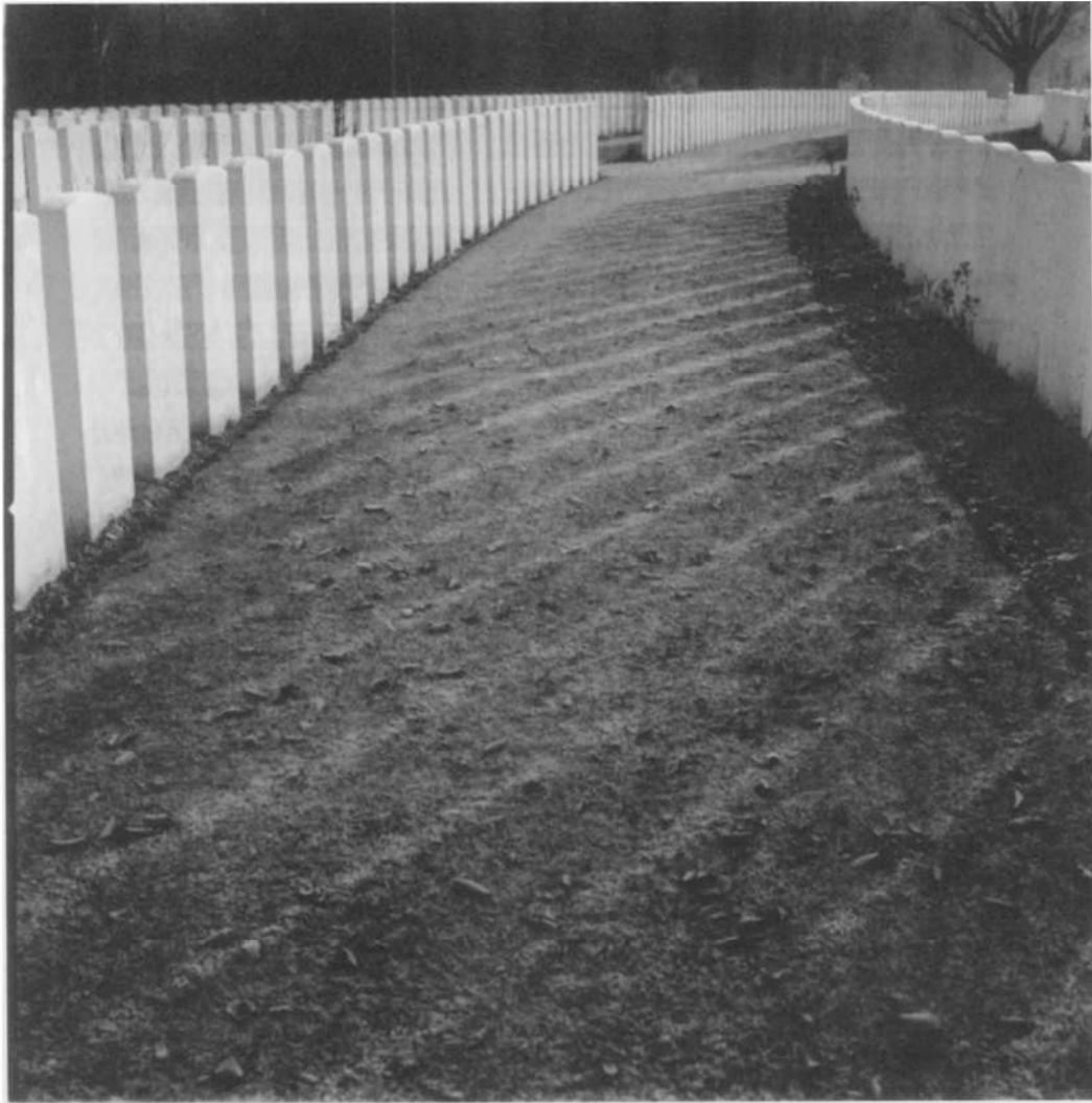
Tyne Cot Cemetery in Passendale