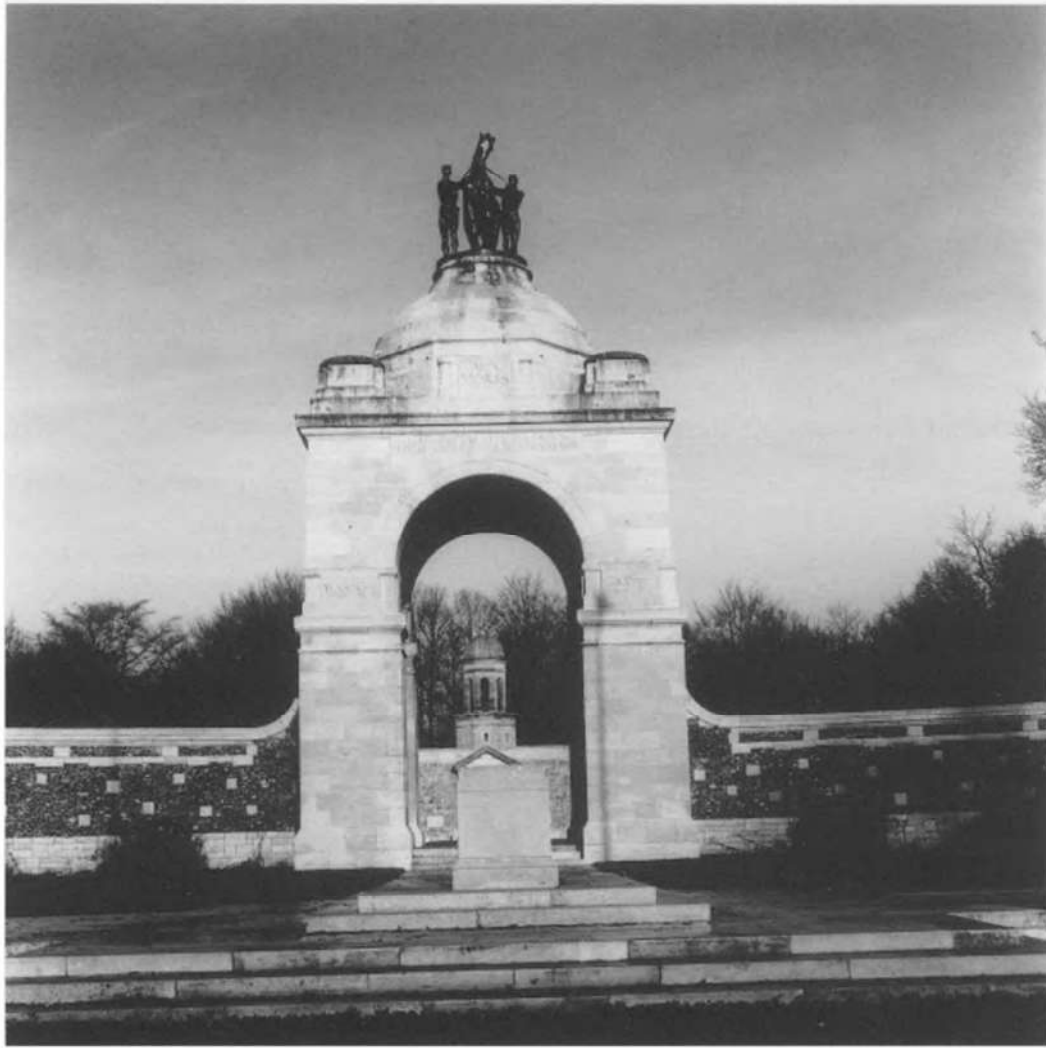
South African National War Memorial Delville Wood - Suid-Afrikaanse Nasionale Oorlogedenkteken van Delvillebos - Longueval

muur “Richtung der Besichtigung”. De Franse en Engelse boodschap staan eronder. Als dat in Frankrijk geen programmaverklaring is. Hier is duidelijk nagedacht over wat een “oorlogsmuseum” kan zijn. De zalen volgen een chronologie: de vooroorlogse periode; 1914-1916; 1916-1918; de naoorlogse periode. In elke zaal staat een oriëntatietafel die duiding en achtergrond biedt. In een auditorium kan je een filmmontage zien over de slag aan de Somme. De collectie wordt gepresenteerd in vitrinekasten aan de wanden en in kuilen die in de parketvloer uitgespaard zijn. Vooral die kuilen vormen een eenvoudige en sterke vondst: de uitgespreide uniformen en bijgeplaatste gebruiksvoorwerpen krijgen iets kwets-