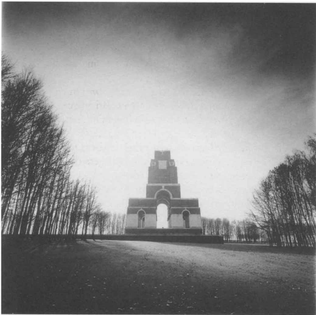
The Missing of the Somme - Thiepval

herdenking van Kristallnacht (9 november 1938) af of Duitsland de “juiste vormen van herinnering” al had gevonden. Bestaat dat: de “juiste” vorm van herinneren? Chirac en Jospin zijn het oneens over “juiste” vormen van herinnering bij het al dan niet rehabiliteren van de muiters van Chemin des Dames.