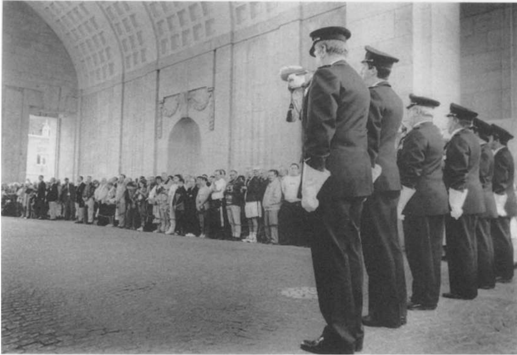
Menenpoort - Ieper. Sinds 1928 wordt hier elke avond de Last Post geblazen door Ieperse brandweerlui

van die lijn die ooit van de Noordzee tot de Zwitserse grens liep. Het golvende landschap had die dag Arcadisch kunnen zijn, ware er geen varkenskwekerij en geen golfterrein geweest. En ik wist niet wat ik het meest moest bewonderen: de veerkracht van dit landschap dat zich weer heeft opgericht en het talent van de mensen die er wonen om te vergeten, of de grandioze en futiele inspanningen om gras gemillimeterd te houden op kerkhoven.