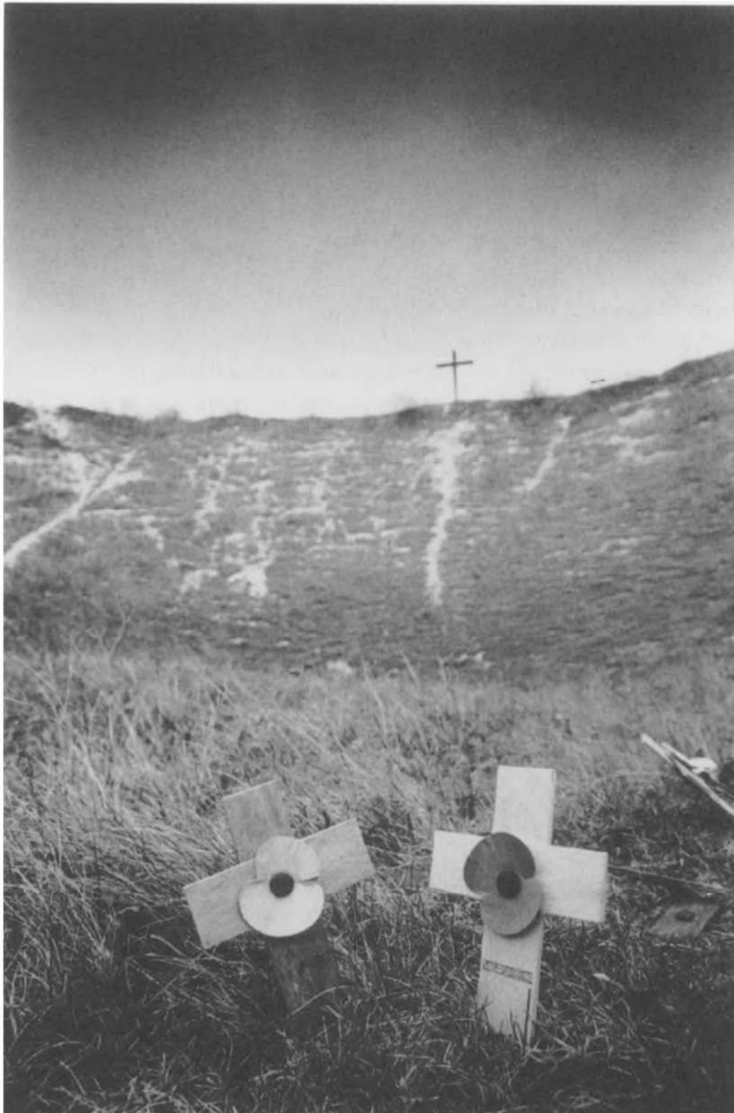
Lochnagar Crater - La Boisselle