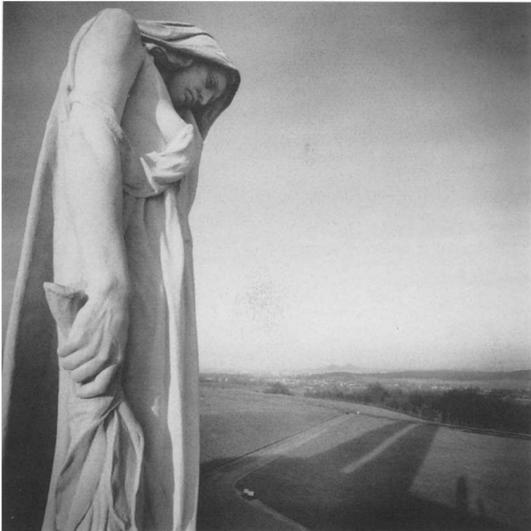
Canadian National Vimy Memorial - Monument commémoratif du Canada te Vimy. Het verdriet van Canada (detail) en de vlakte van Lens

De Duitsers hebben alleen kerkhoven in Vlaanderen en Noord-Frankrijk: je verliest niet straffeloos een oorlog. De retoriek van hun dood is er één in mineur, melancholie heerst er sterker dan geometrie. Het gemillimeterde gras van de Britse kerkhoven is er vervangen door bomen.