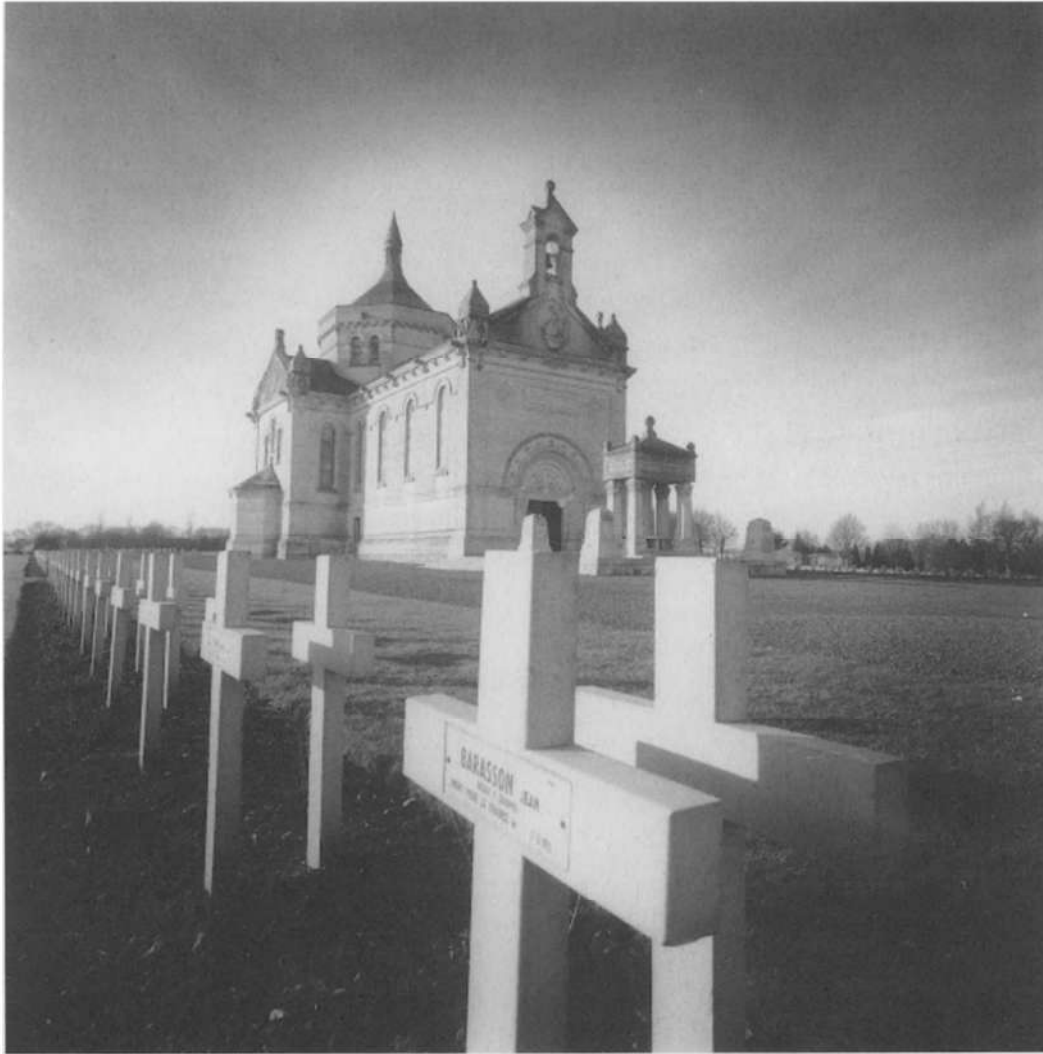
Nationale Militaire begraafplaats van Notre-Dame-de-Lorette

een streek. Wat heb je overigens zelf gedaan in de herfst van 1998? Deze lijst is uiteraard eindeloos. Elke lieu zou een artikel op zich verdienen.