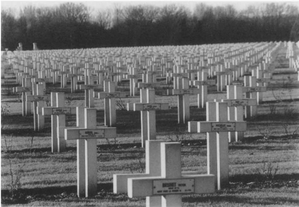
Nationale Militaire begraafplaats van Notre-Dame-de-Lorette

kameraden gooit, de offerbereidheid voor. Boven hen verbeelden allegorische figuren de rechtvaardigheid, vrede, waarheid, kennis, moed en sympathie. De indrukwekkendste figuur is een treurende, gesluierte vrouw die Canada voorstelt en links vooraan de vlakte van Lens domineert waar de terris de inspanningen van de mijnwerkers tijdens de Eerste Wereldoorlog in gedachten houden. In het park rond het monument, waar schapen het gras kort grazen en loopgraven zo netjes zijn bijgehouden dat ze speelterreinen lijken, zijn 11.285 pijnbomen en esdoorns geplant die evenveel Canadezen moeten vervangen die geen bekend graf hebben gevonden. Hun namen staan ook op het monument ingegrift. Her en der rimpelt en golft het door bommen omgeploegde landschap. De bezoeker wordt gewaarschuwd voor deze vreemde, hobbelige, met gras begroeide bomkraters, een landschapsarchitectuur die er vandaag idyllisch uitziet.