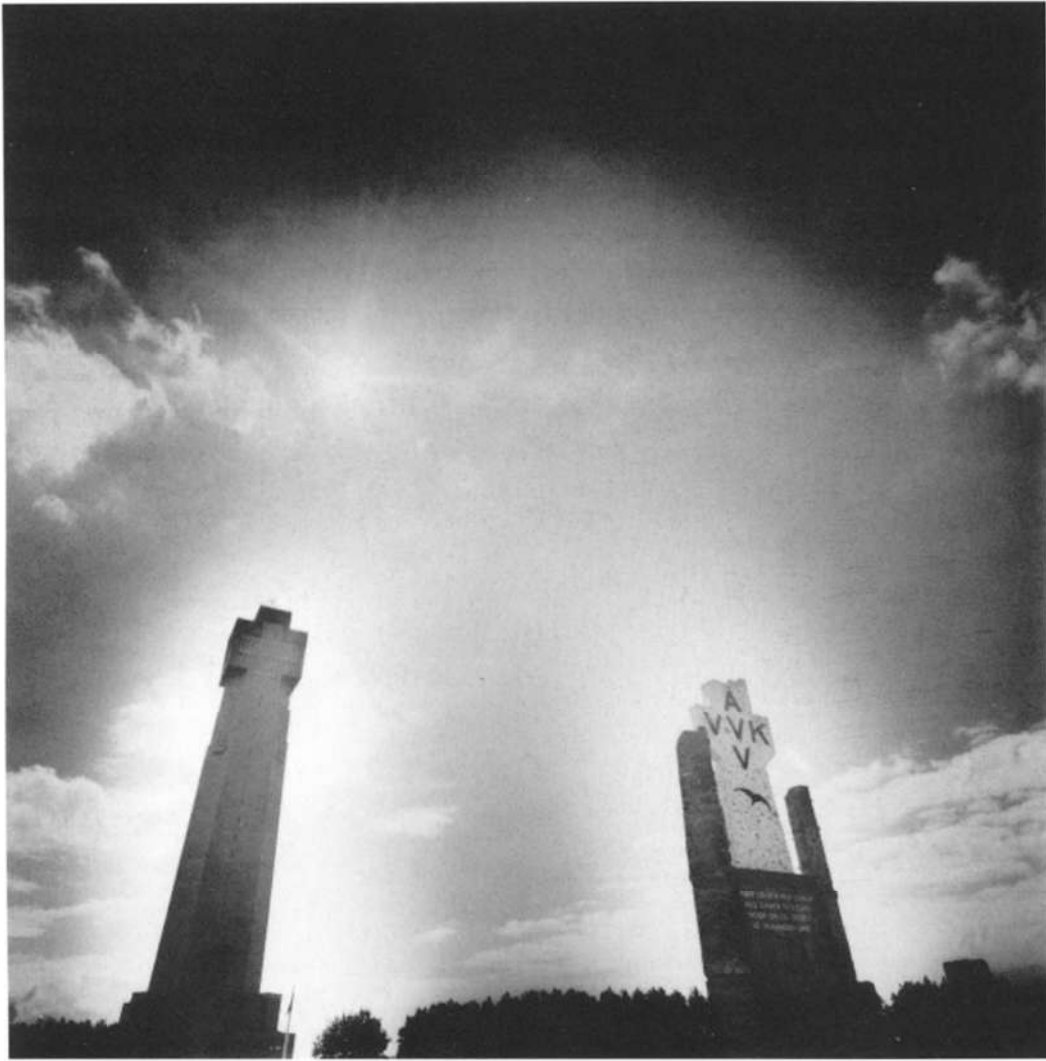
De "IJzertoren" - Diksmuide. Op de voorgrond de resten van de eerste IJzertoren met het Heldenkruis

schikt aan het gemeentelijk kerkhof. In Pont-de-Nieppe bij Armentières zag ik mijn eerste Friedhof op Franse bodem, omzoomd door een haag onder majestueuze treurwilgen. 790 Duitsers liggen er hoofd aan hoofd onder een zwart metalen kruis. Het duurt een tijd tot je tussen die zwarte monotone stenen zerken opmerkt die bij het naderen een Davidsster blijken te dragen: joodse vrijwilligers die voor Duitsland gesneuveld zijn. In het licht van de oorlog die zou komen na deze krijgen deze geïsoleerde en daardoor des te opvallender graven een nieuwe betekenis. Aan de andere kant van het gemeentelijk kerkhof, dat blijkbaar als buffer dient, wappert een Franse vlag en liggen twee rommelige rijen Franse doden uit de