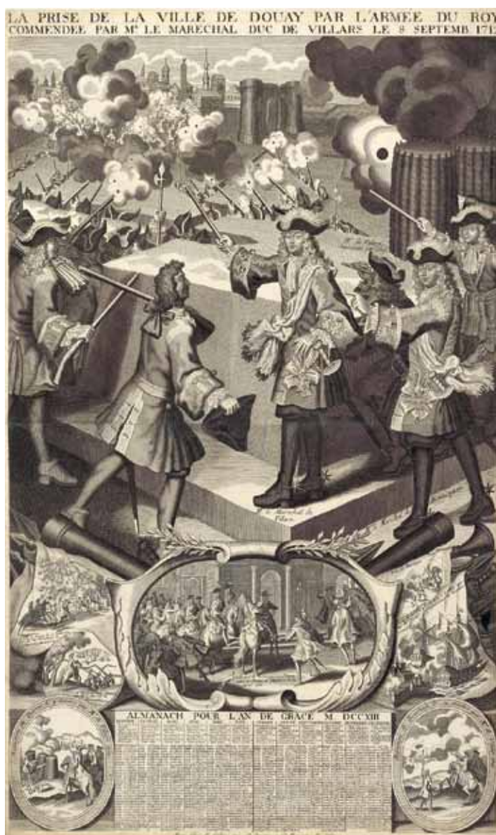
De val van Dowai voor de troepen van Villars. Almanach Royal, 1713. Bibliothèque nationale de France.

Op 11 april 1713 werd Karel VI, op basis van de Vrede, de nieuwe landsheer over de Zuidelijke Nederlanden, maar nog tot 1716 moest onderhandeld worden met de Anglo-Bataafse Conferentie om de overdracht van het gebied aan de Oostenrijkse dynastie te formaliseren. De besprekingen leidden