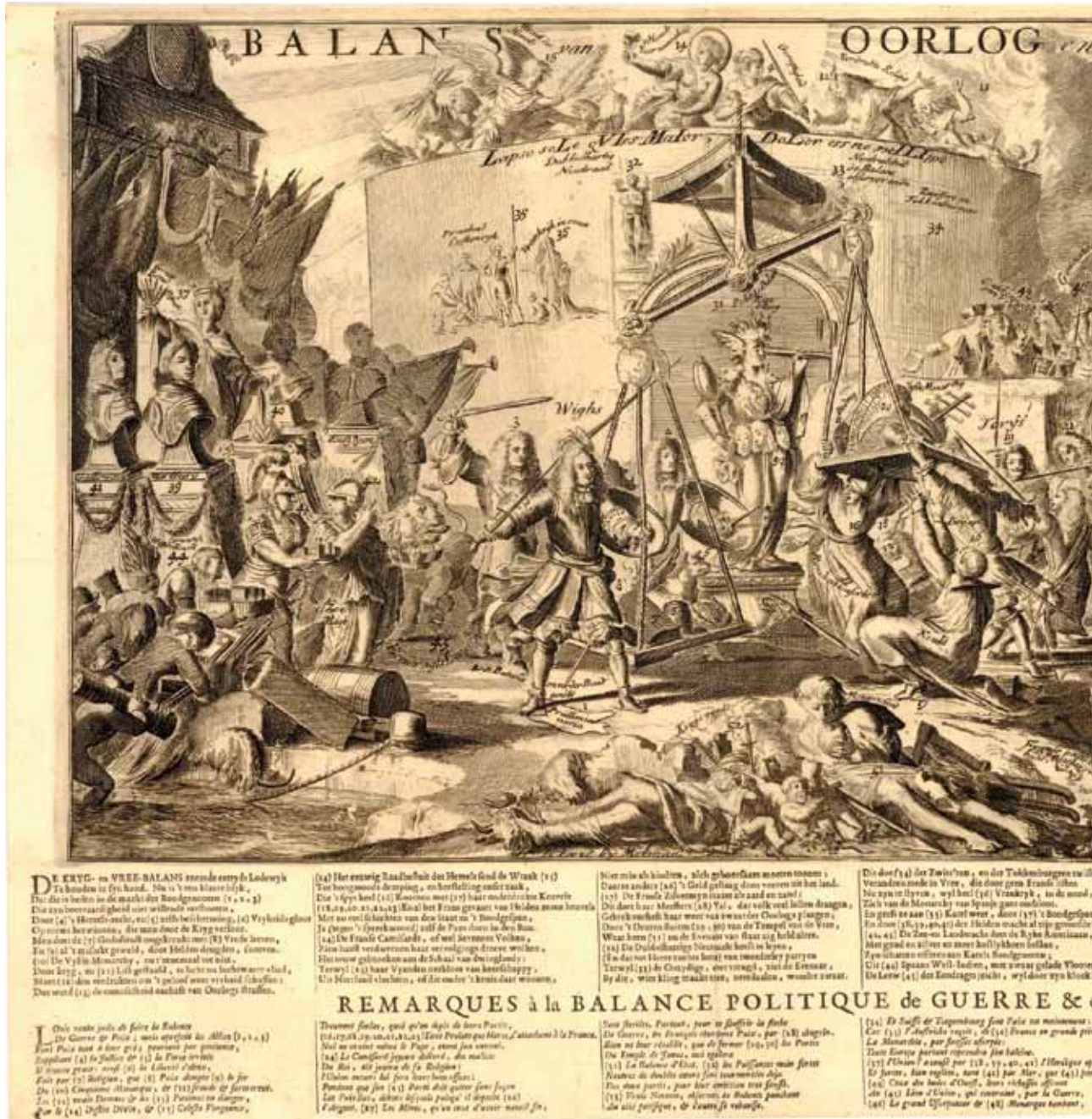
Romeyn de Hooghe, Balans van Oorlog en Vrede, Utrecht, 1712 [1674].