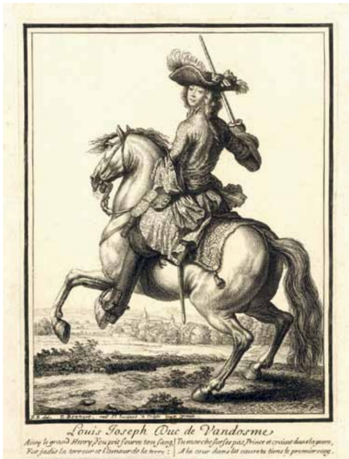
Louis-Joseph de Vendôme, ruitersportret.

partijen. De katholieke Oostenrijkse Nederlanden moesten tolereren dat het Nederlandse garnizoen de protestantse eredienst kon vieren en zeker nog het meest dat ze voor de kosten op moesten draaien. Deze vorm van bezetting hield stand zolang Frankrijk het gebied bleef bedreigen, wat tot 1748 het geval was. Toen weigerde de landsvrouw, keizerin Maria-Theresia, nog langer te betalen en onder druk van haar opvolger, Jozef II, kwam er in 1782