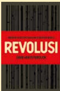
DAVID VAN REYBROUCK, Revolusi. Indonesië en het ontstaan van de moderne wereld , De Bezige Bij, Amsterdam, 2020, 656 p.

Van Reybrouck schrijft precies zoals het politiek correcte Nederlandse leespubliek het nu graag wil lezen. Zeg maar een soort Kuifje op Java . Ik heb dit boek lang tevoren zien aankomen, me erop verheugd. Een Vlaming die de Hollanders eventjes de les komt lezen! Niets van dat. Het enige positieve eraan is dat hij het grote publiek bereikt. Misschien was dat ook wel zijn voornaamste doel. Dit boek behoeft een grondige herziening. Tot dan zijn de Hollandse historici van eerder genoemde instituten aan zet. Ze kunnen hier toch moeilijk van onder de indruk zijn.