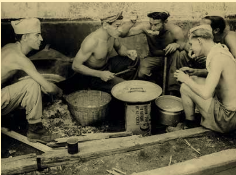
Een groepje Nederlandse mariniers eet op een deksel gebakken eieren in Loemadjang aan het begin van de eerste politionele actie, Oost-Java, 22 juli 1947

nog levende getuigen van de onafhankelijkheidsstrijd [...] Ook in Nederland bracht zijn onderzoek tal van nieuwe verhalen aan het licht.”