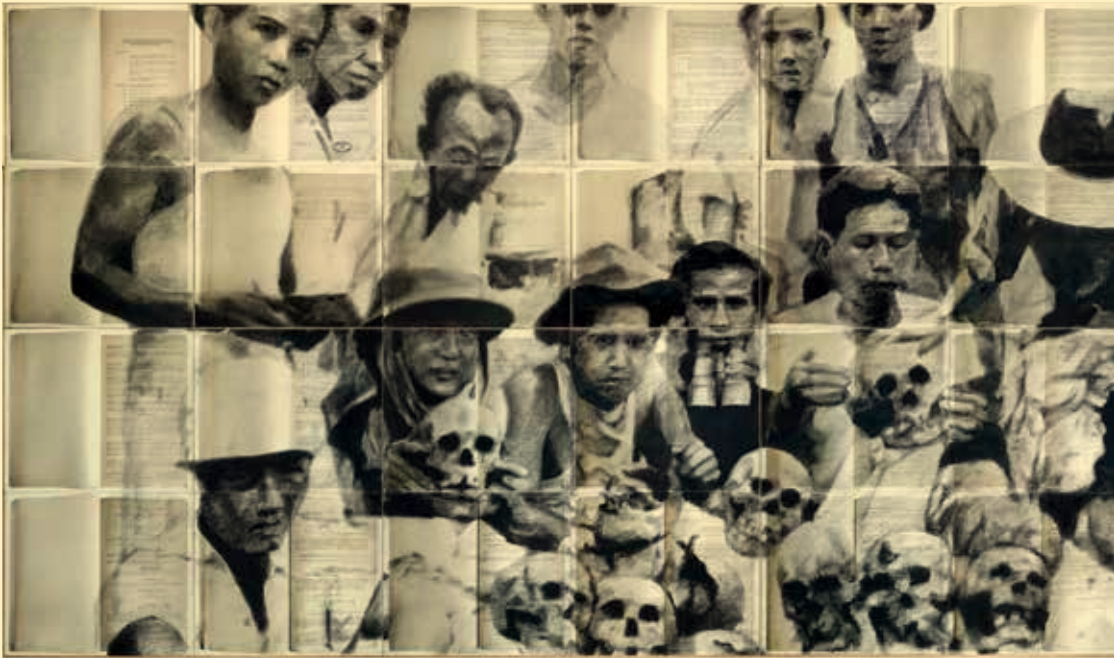
FX Harsono, Memorandum of Inhumane Acts , 2016, installatie

homoseksuelen, daklozen en, ja gut, criminelen – en schiet zo zijn doel hopeloos voorbij. De romusha's (Indonesische dwangarbeiders onder de Japanners) zijn veel belangrijker in de aanloop naar de Indonesische revolutie. Ontelbaren lieten het leven.