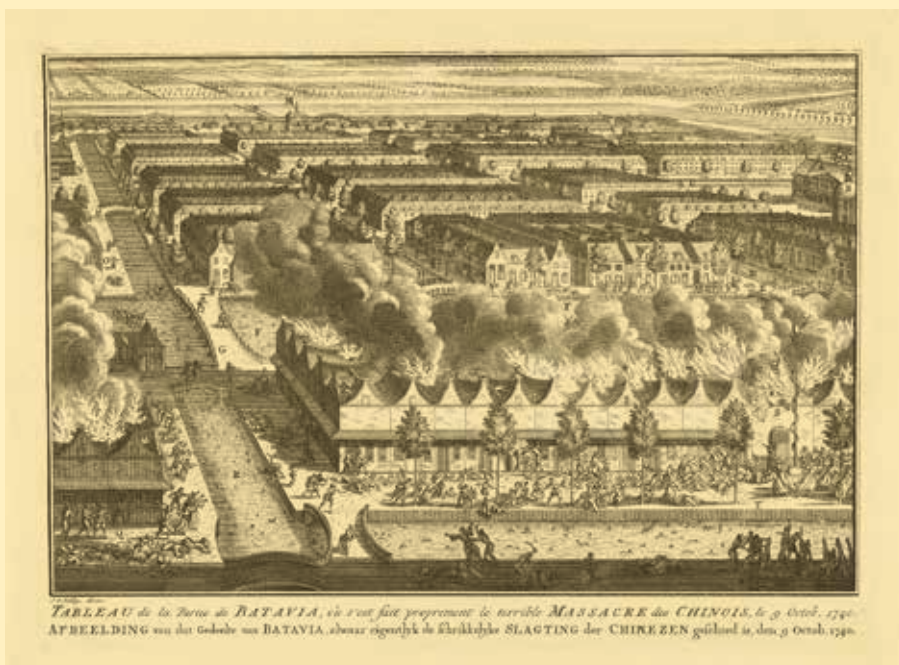
Jacob van der Schley, Moord op Chinezen te Batavia, 1740 , naar Adolf van der Laan, 1761 – 1763