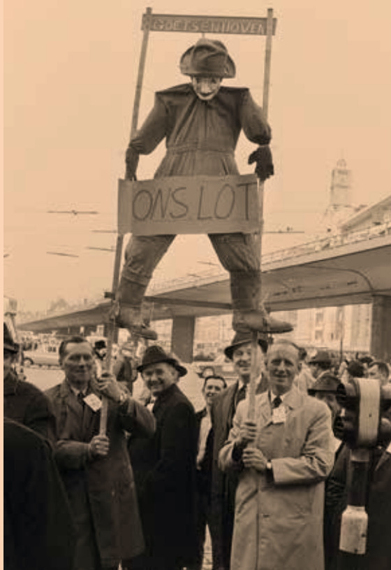
Betogende boeren met een pop aan de galg en een bordje 'Ons lot'. 'Hitler vermoordde de Joden, Mansholt de boeren', was een andere slogan tijdens de betoging