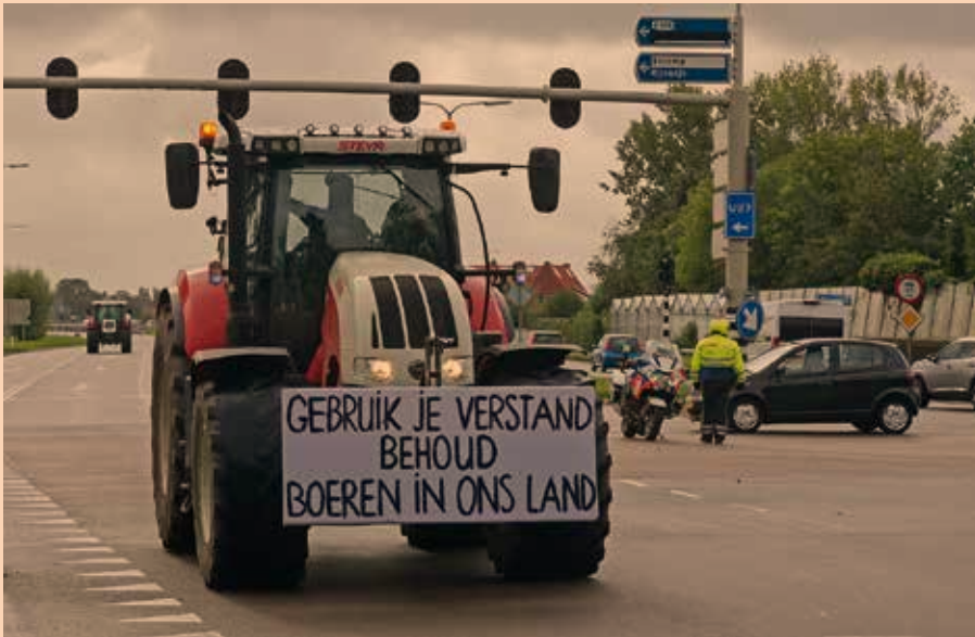
Boeren nemen stereotypes soms ook over. Kijk naar de boerenprotesten: op hun trekkers reden ze naar Den Haag. Ze voldoen aan het beeld dat de stad van hen heeft en weten dat ze daarmee scoren