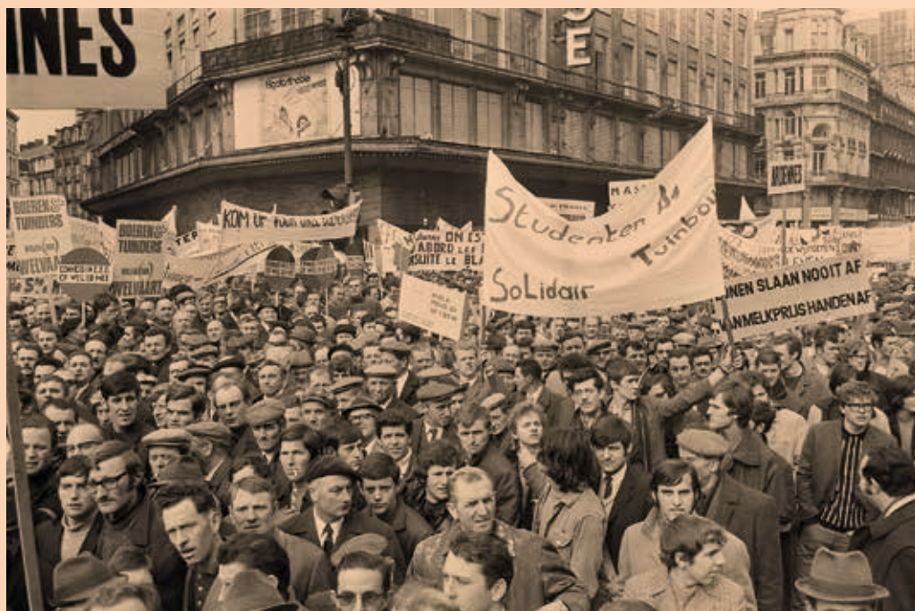
'Wie op 23 maart niet opmarcheert, verdient niet langer de naam van boer te dragen', zo luidde de oproep om deel te nemen aan de betoging in Brussel op 23 maart 1971