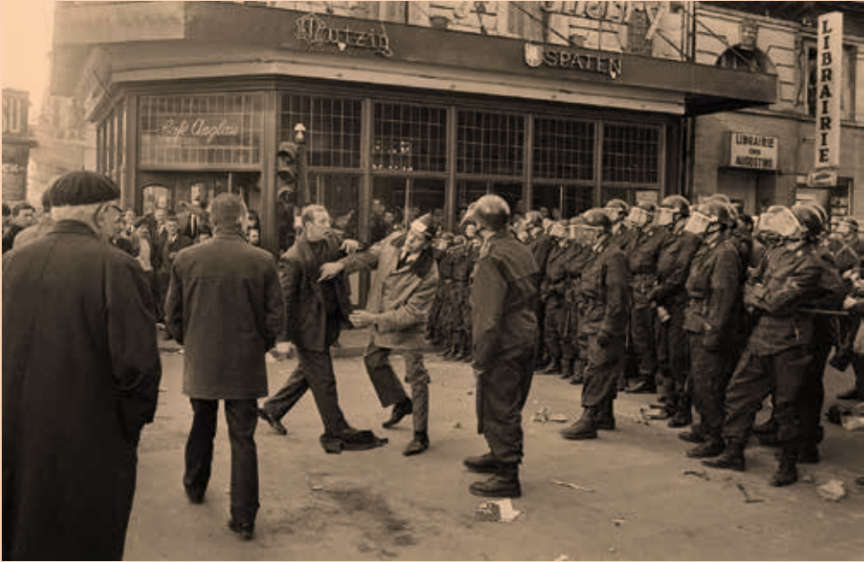
De rellen en de enorme schade lieten een diepe indruk na bij de betogers, van wie velen pas voor de eerste keer in Brussel waren

schreef: “We kunnen ons niet van de indruk ontmaken, dat met de betoging van 23 maart een nieuw hoofdstuk in de geschiedenis van de Belgische boerenstand is begonnen. (...) Drieëntwintig maart heeft wellicht de hardste koppen duidelijk gemaakt, dat men niet ongestraft speelt met het bestaan van de boeren.”