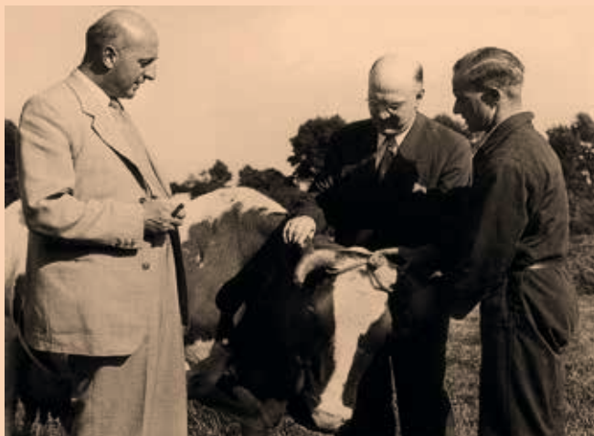
Sicco Mansholt (links) als Nederlands minister van Landbouw in juli 1951