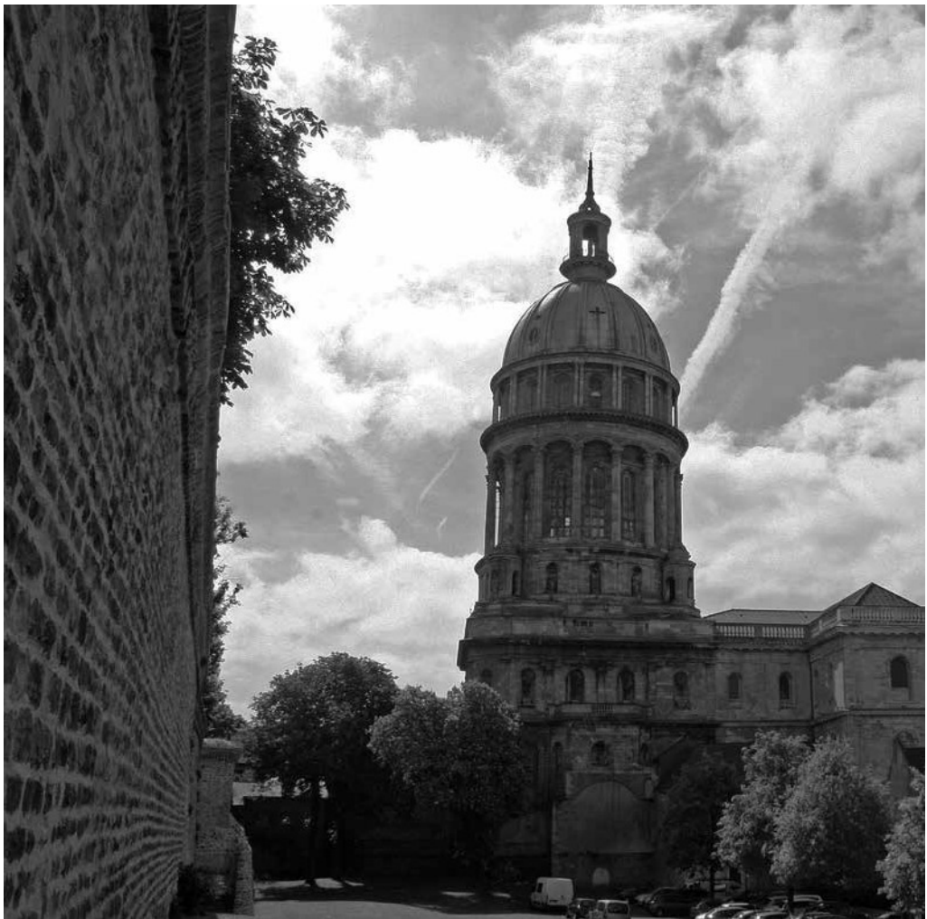
Baseliek Notre-Dame / La basilique Notre-Dame