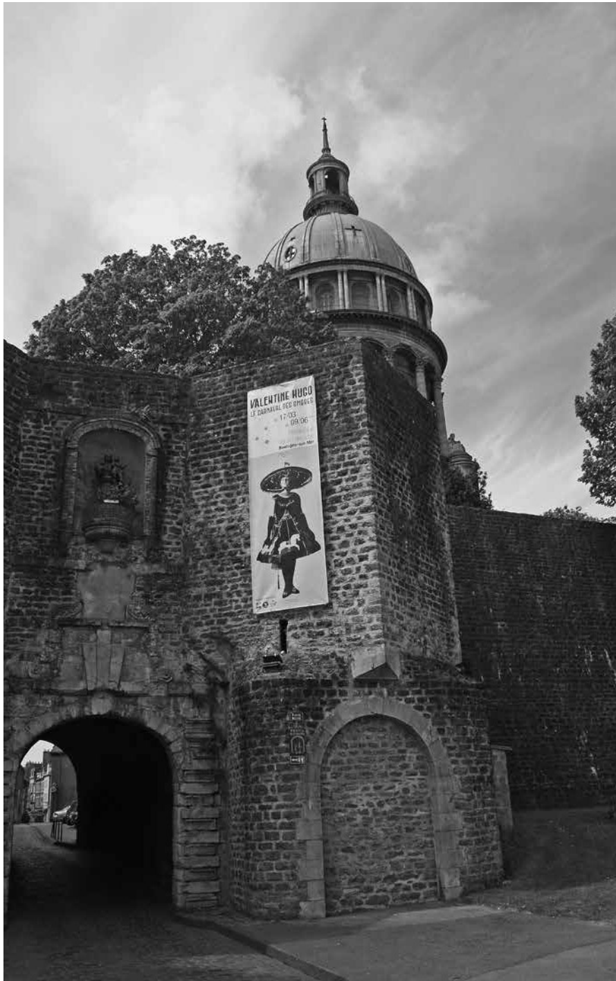
Porte Flamengue, nu Porte Neuve met aankondiging voor de tentoonstelling van Valentine Hugo / Porte Flamengue, rebaptisée Porte Neuve (affiche annonçant l'exposition consacrée à Valentine Hugo)