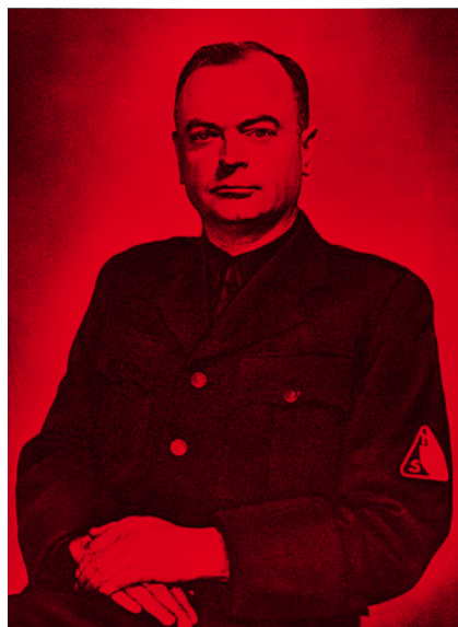
Anton Mussert, © Nationaal Archief

In vergelijking met Europese zusterpartijen toonden de vele varianten van het Nederlandse fascisme zich bepaald minder revolutionair