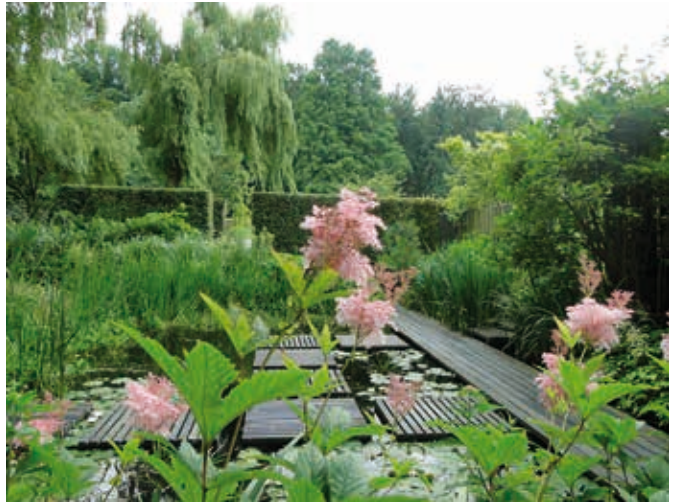
Een door Mien Ruys ontworpen tuin.

Volgens Ruys moest in iedere tuin iets van de 'grootheid en veelzijdigheid' van de natuur te herkennen zijn