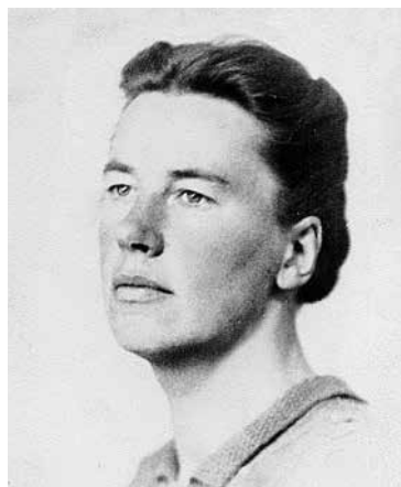
Mien Ruys.