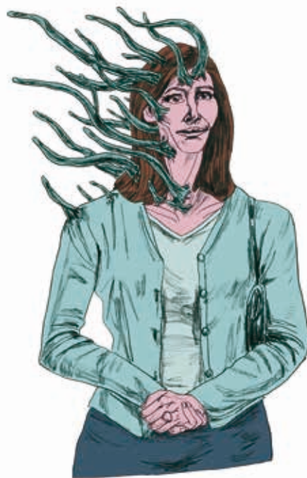
Illustraties voor het tijdschrift Oogst , © Wide Vercnocke

Hoewel de albums die hij voor Bries maakt tot zijn opvallendste werk behoren, stopt het daar niet voor Vercnocke. Zo schrikt hij er in tegenstelling tot veel andere tekenaars niet voor terug om publieke performances te geven. Zijn invalshoeken zijn daarbij divers, maar opnieuw gaat het om combinaties van poëzie en illustratie: voor het hippe tijdschrift Oogst verzorgde hij de illustraties van het derde