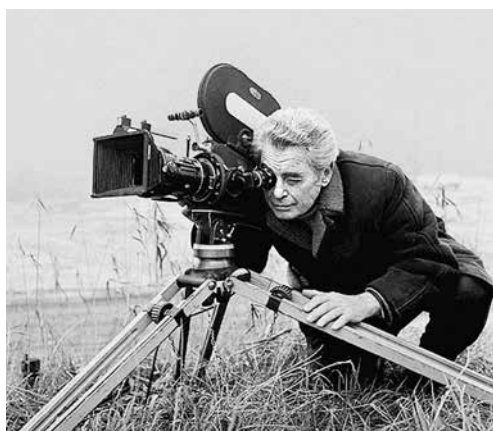
Joris Ivens