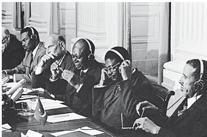
Marinus van der Goes van Naters in 1966 op de Conferentie van Afrikaanse Landen in Den Haag