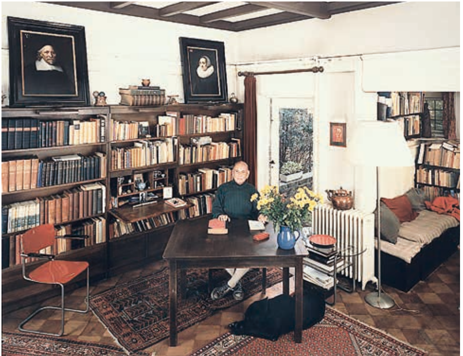
Marinus van der Goes van Naters in zijn bibliotheek, collectie Rijksmuseum, Amsterdam