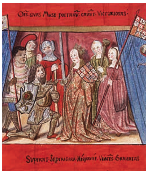
Illustraties die de Blijde Intrede van Johanna in Brussel verbeelden, een gebeurtenis waarbij Jan Smeken een gedicht schreef