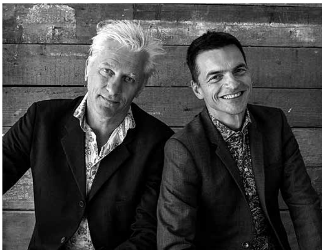
Rick de Leeuw en Remco Sleiderink