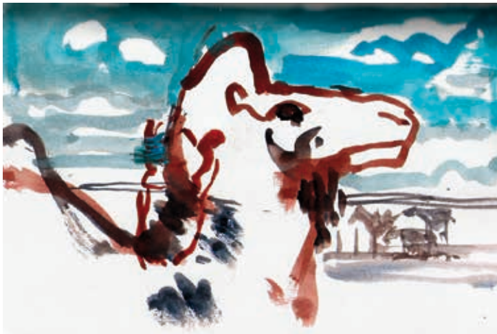
'Zingende kamelen', uit: Een stem van paardenhaar , AzulPress, 2015, © Lies van Gasse

Het werk van Lies van Gasse verschijnt bij Wereldbibliotheek en bij diverse kleinere uitgeverijen, www.liesvangasse.be