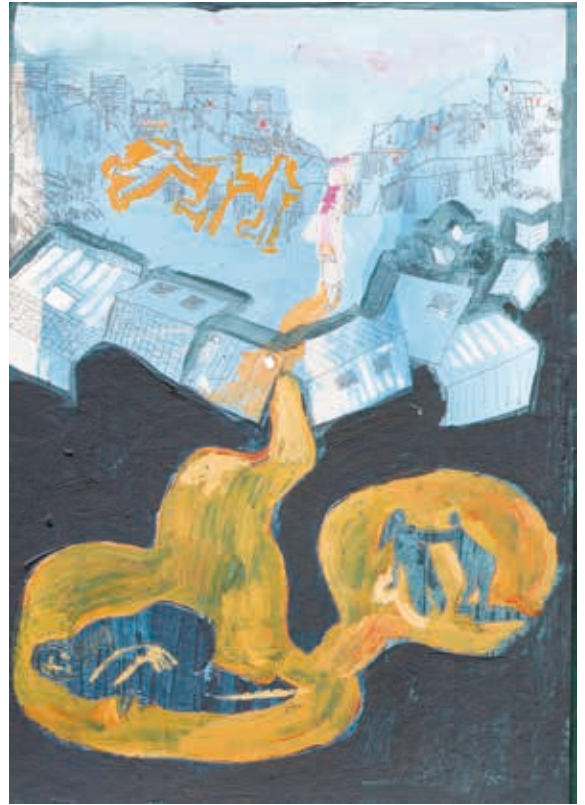
Uit: Exodus , Poëziecentrum, 2016. © Lies van Gasse

Door het bevragen van die binaire logica wordt onvermijdelijk ook de suprematie van de mens in het algemeen, en het dichterlijke ik in het bijzonder, in vraag gesteld. Het ik trekt zich soms terug in de intimiteit van het binnenbestaan, maar zelfs daar