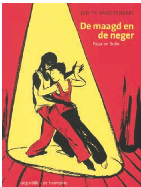
De maagd en de neger,