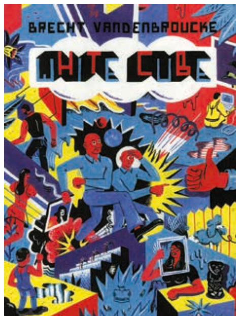
De kافت van White Cube , © Brecht Vandenbroucke