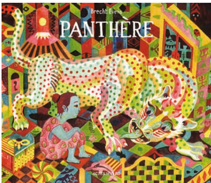
De kapt van de Franse vertaling van Panther