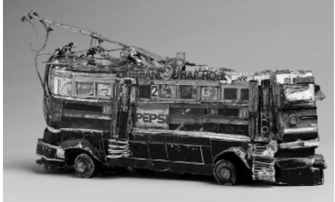
Willem van Genk, Trolleybus , circa 1990, gemengde techniek, 26,5 x 80 x 13 cm, Stichting Collectie De Stadshof, Foto Clemens Boon.

moment blijven vertegenwoordigen en is van cruciaal belang bij de groeiende faam van de kunstenaar. Begin jaren tachtig verkoopt Hamer sporadisch werk van Van Genk, voor enkele duizenden guldens. Eind jaren negentig zijn de bedragen al bijna vertienvoudigd en is de vraag vele malen groter dan het aanbod. In 1998 is er een grote overzichtstentoonstelling in museum De Stadshof in Zwolle. Van Genk is daarbij nog wel aanwezig, maar kan de feestelijkheden slechts zijgend en in een rolstoel ondergaan. Actief als kunstenaar is hij dan al niet meer