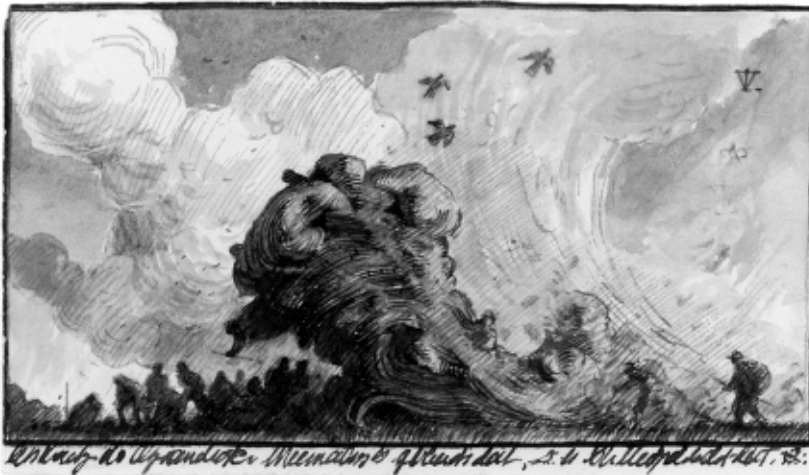
Tinus Vermeersch, zonder titel, 2005, 8 x 13,5cm, bruine inkt en aquarel op papier

In 2009 maakt Vermeersch, schijnbaar volledig in disharmonie met de rest van zijn oeuvre een reeks van twaalf tekeningen die stadslandschappen weergeven – de reeks ontstond nadat hij een jaar in New York werkte als assistent van zijn broer (kunstenaar Pieter Vermeersch). De werken tonen rijen opeengepakte huizen en verschillen visueel van zijn landschappelijke werk. Niettemin liggen ze qua werkwijze in het verlengde ervan: ook in deze tekeningen heeft de kunstenaar zijn intuïtie laten spreken en zo ontstonden de stedelijke omgevingen met gebouwen die nu eens in opbouw lijken, dan weer in afbraak. En evenmin als in de rest van zijn