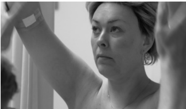
Still uit Wakker in een boze droom , Foto Peter Lataster © Lataster&Films 2013.