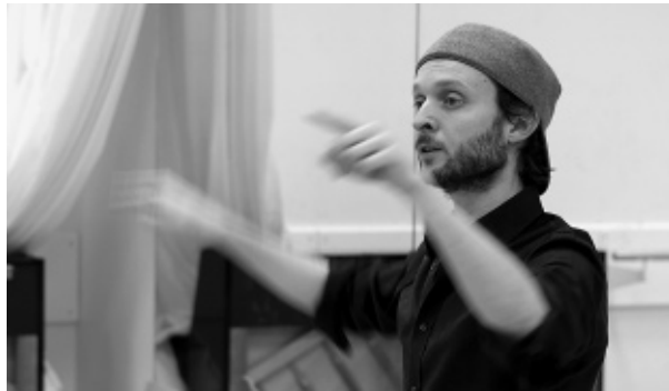
Still uit De nood aan dansen over Sidi Larbi Cherkaoui, Foto Peter Lataster © Lataster&Films 2014.