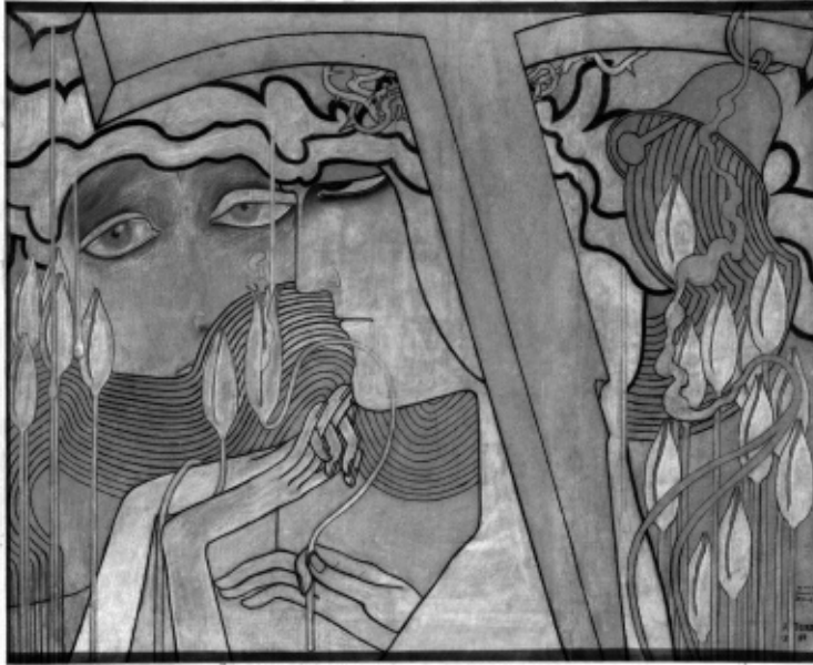
Jan Toorop, Verlangen en Bevreddiging , 1893, potlood, zwart krijt, gele en blauwe pastel, wit gehoogd, op beige papier op karton, 76 x 90 cm, Musée d'Orsay, Parijs.

de Sint Bernulphuskerk in Oosterbeek. Bijzonder is dat de Bernulphuskerk vijf van de veertien staties uitleende, en dat terwijl Goede Vrijdag in de tentoonstellingsperiode valt. De staties, in omgekeerde volgorde getoond, zijn samen met de krijt- en houtskooltekeningen van de apostelen uit de collectie van het Stedelijk Museum Amsterdam van absoluut topniveau.