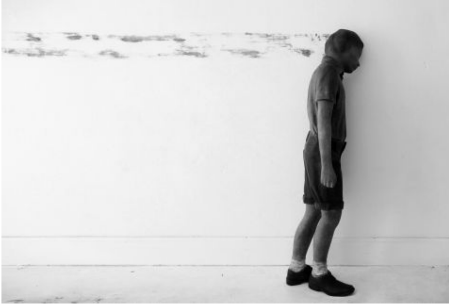
Brandt (2001) © Sofie Muller.