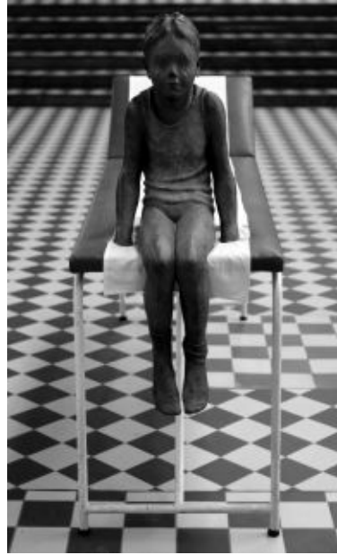
Shemale Child (links) uit 2006 en Tristan uit 2007 © Sofie Muller.

lichaam. De tentoongestelde torso's herinneren aan de mensfiguren van die andere grote Gentse kunstenares, Berlinde De Bruyckere.