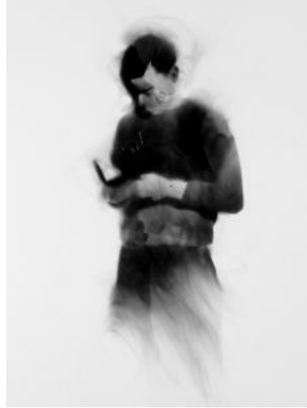
Smoke Drawings (2011) © Sofie Muller.

zijn bovenlichaam, waarvan alleen nog de torso overblijft, bestaat uit verbrand hout. Brandt , de derde schooljongen, is wellicht Mullers sterkste beeld tot nog toe. Ook deze geüniformeerde scholier bestaat uit gepatineerd brons (het hele lichaam) en verbrand hout (het hoofd). Hij leunt met zijn hoofd tegen de muur, lijkt te stappen, en laat zo een houtskoolspoor achter op de muur. Alsof hij om zijn herinneringen weg te vagen ook zijn hoofd moet wegvagen.