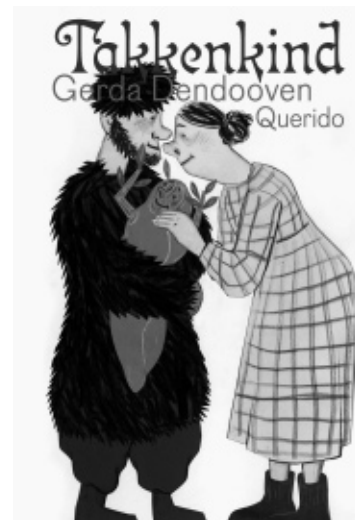
Vijf recente boeken van Gerda Dendooven, © Gerda Dendooven / Uitgeverij Querido.