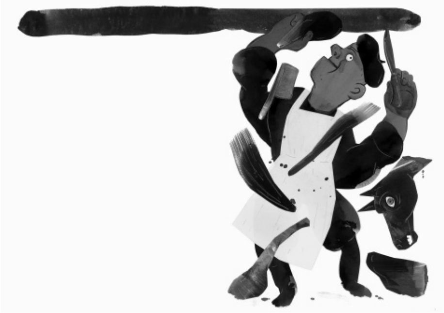
Een illustratie van Gerda Dendooven uit Wie klopt daar? (2012), een tekst van Bart Moeyaert © Gerda Dendooven / Uitgeverij De Eenhoorn.

en werd door de Conseil Général van Seine-Saint-Denis als geschenk verdeeld in de plaatselijke crèches. Het Roodkapje-verhaal is hier geestig en tegelijk angstaanjagend op zijn kop gezet. Roosje Rood heeft de buik van de wolf dichtgenaaid en gaat met een rist sprookjesfiguren in haar kielzog op zoek naar haar moeder, die ze uiteindelijk terugvindt. Opnieuw geen vanzelfsprekende moeder, maar een wuft zwart dametje met blikkerende tanden dat opvallend veel weg heeft van de wolf zelf. Over het overwinnen van angsten gaat het in Het verhaal van slimme krol (2006). Een kereltje daagt onvervaard monsters en spoken uit om zichzelf uit te testen. Alleen worden het er wat veel, en daar had hij niet op gerekend. Het hele prentenboek wordt een wervelend feest van plastisch en dramatisch in beeld gebrachte skeletten en ander akeligs tegen een hoofdzakelijk zwart decor.