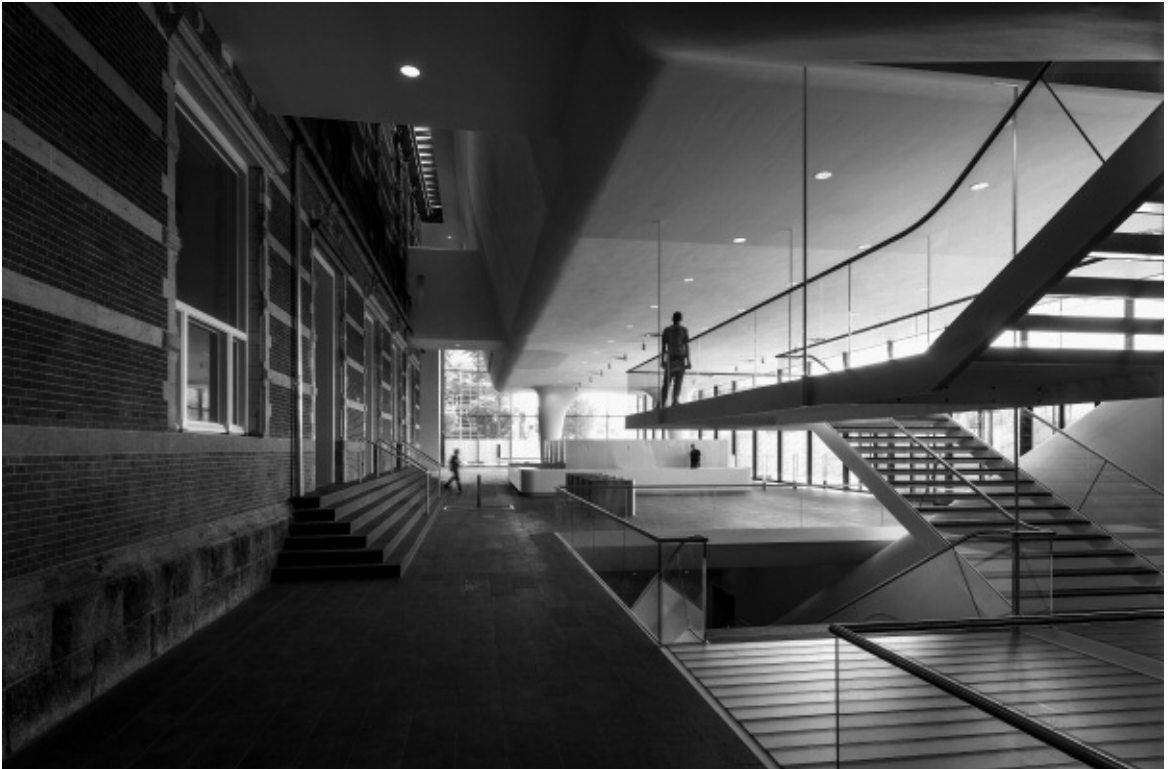
De nieuwe inkomhal van het Amsterdamse Stedelijk Museum, dat in oktober 2012 heropende na jarenlange sluiting wegens verbouwingen, Foto John Lewis Marshall.