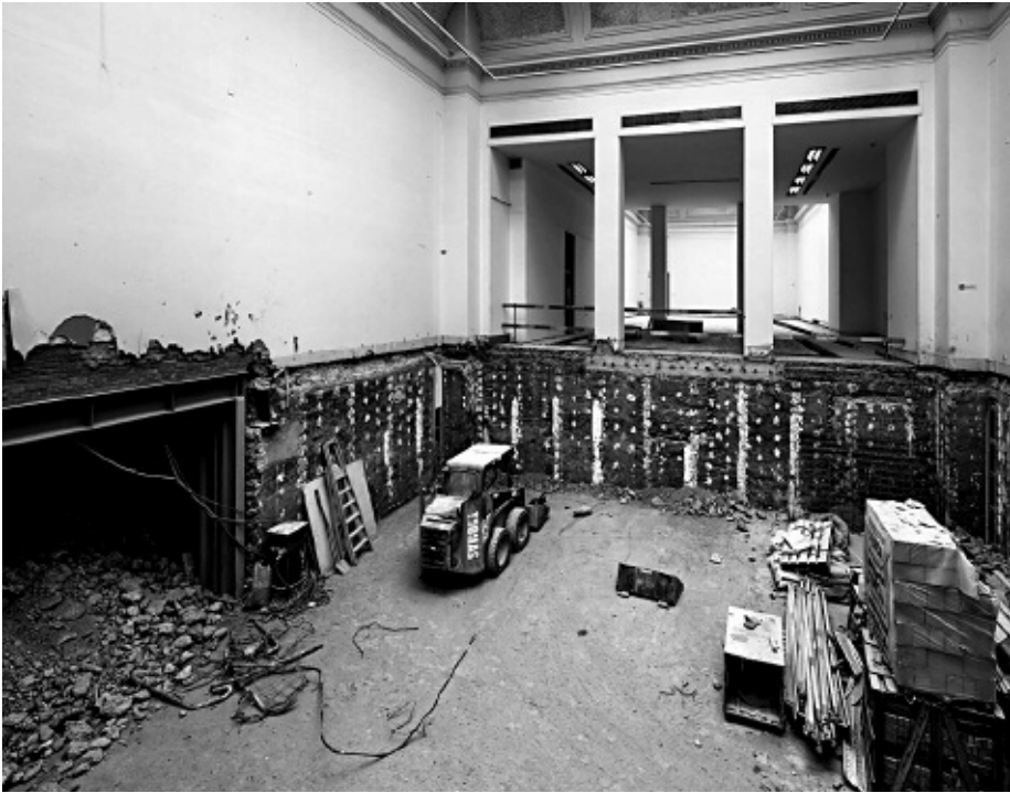
Boven: verbouwingen in het Koninklijk Museum voor Schone Kunsten in Antwerpen (KMSKA), Foto Karin Borghouts.