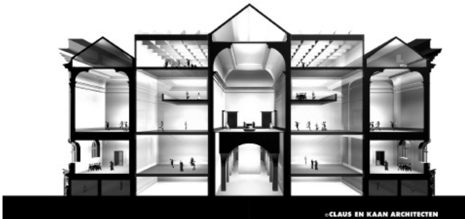
Onder: een computersimulatie van het verbouwde KMSKA, © Claus en Kaan Architecten.