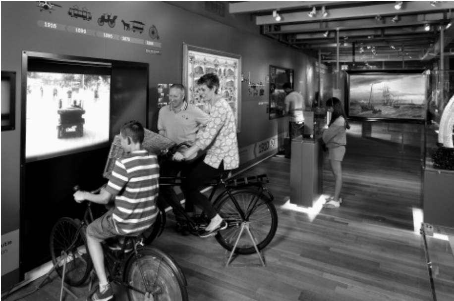
Zaalzicht van Amsterdam DNA , een laagdrempelige versie van de presentatie van de vaste collectie in het Amsterdam Museum.

gemaakt. “De link www.temporarystedelijk.nl is niet van het Stedelijk zelf en de georganiseerde tentoonstellingen zijn dat dus ook niet”, zeggen de initiatiefnemers op de website. “Door de domeinnaam te kopen, zijn we als het ware door de achterdeur naar binnen geglipt om het werk van jonge kunstenaars uit de stad op het podium van het gesloten museum te zetten.” Het echte Stedelijk is sinds september 2012, vier jaar later en twintig miljoen duurder dan gepland, weer open.