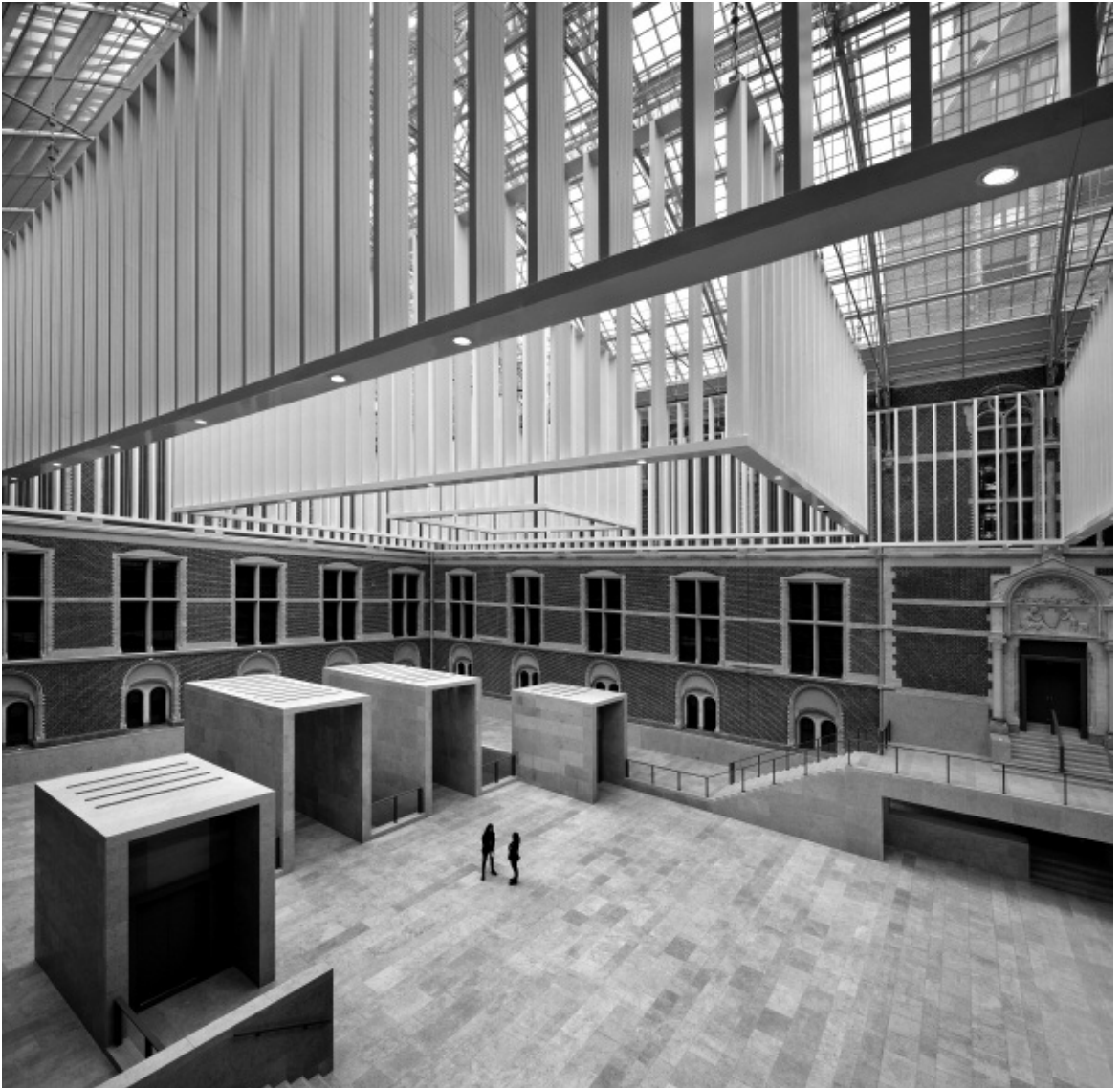
Het Atrium van het Amsterdamse Rijksmuseum, dat op 13 april 2013 na tien jaar verbouwen opnieuw de deuren opent, Foto Pedro Pegenaute.