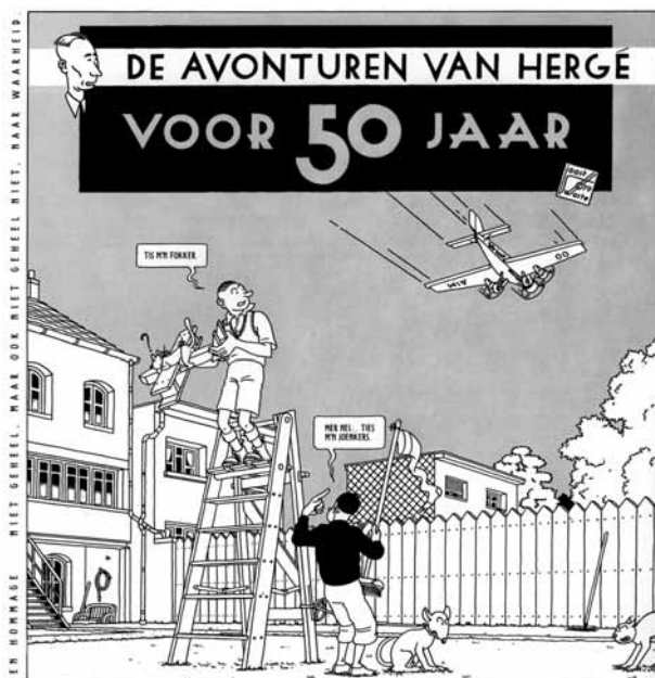
Beeld uit een "hommage" aan Hergé (1979), opgenomen in Swartes verzamelde werk Bijna compleet (2011) © Joost Swarte / Oog & Blik.

waaraan hij geregeld bijdragen levert, maakte hij in 2007 de cover Summer Reading . Die werd uitgeroepen tot beste cover van het jaar. De tekening treft het gevoel dat je in New York overvalt, dat je omringd en overschaduwd wordt door eindeloos hoge flats, dat je op zoek moet naar je eigen stukje blauwe lucht. Het boek biedt troost, in een boek kun je overal zijn. De zon schijnt tussen de flats door precies op de parasol van de lezer.