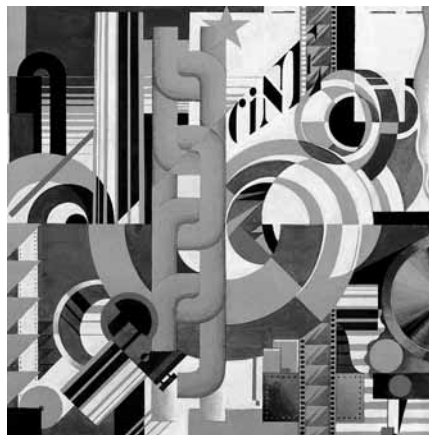
Victor Servranckx, Opus 11 , 1920, Collectie Mu.ZEE, Oostende / © Sabam Belgium 2012.

onderzochte en herinnerde tentoonstellingen in het buitenland, met museale tentoonstellingen in 1927 in het Musée de Grenoble en voor Servranckx ook in het Brooklyn Museum in New York een jaar eerder, in 1926. Het is typerend dat de kunstenaars zelf weinig melding maakten van deze erkenning: in eigen land was de beweging morsdood. De pioniers van de abstractie zullen in eenzaamheid een eigen en authentiek parcours bewandelen. Servranckx zal later zelf spreken over het beperkende aspect van het “zuivere” experiment. Eenzelfde geluid is bij anderen te horen, zoals bij De Boeck. Puur geschiedkundig is het echter moeilijk te achterhalen vanaf wanneer deze gedachte ingang vindt. Het zijn steeds post-factumgetuigenissen die, in het slechtste geval, vergoelijkend in de oren klinken.