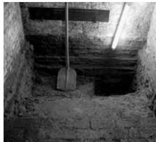
Performances 5, 69, 100 en 132 van Danny Devos. Met de klok mee: Five Cuts (27 IX 1979); Pro Breendonk (VII 1984); The Murder of Ilona Harke (IV 1993) en Diggin' for Gordon (20 II 2006 – 2010), Foto's Danny Devos.

De redenen voor DDV's randpositie in de kunstwereld lijken meervoudig. Zo is performancekunst vanzelf al een artistiek medium dat slechts gedeeltelijk (via foto's, video's of protocollaire beschrijvingen) is te conserveren en verhandelen. Bovendien voelt DDV weinig voor een van performance afgeleide, parallelle kunstproductie. Ook slaat DDV's interesse voor misdaad en geweld niet meteen aan bij de gemiddelde kunstliefhebber. Jarenlang heeft hij zich beziggehouden met seriemoordenaars en hield hij er een briefwisseling op na met de Amerikaanse seriedoder John Wayne Gacy. Toch lijkt een morele veroordeling van zijn werk paradoxaal in een samenleving waarin het brede publiek via kranten, tijdschriften, misdaadromans en televisieseries