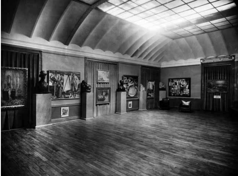
Zicht van de tentoonstelling in het Musée de Grenoble in 1927.