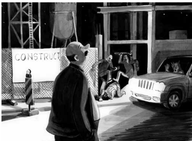
Afbeelding uit Burgerlijke schemering , 2010 © Steve Michiels & Uitgeverij Vrijdag.

En dan begint Steve Michiels met zijn krachttoer: hij switcht voortdurend van de gelagzaal naar de huiskamer. In de huiskamer drinken de vriendinnen wijn en eten taartjes en pralines. Ondertussen wisselen ze kleine drama's en groot verdriet uit. In de gelagzaal maken we de entree mee van een motorclub, op de soundtrack van ‘Sympathy for the Devil’ van de Rolling Stones. De motorrijders lachen de trotse bezitter van de 4x4 vierkant uit. In de woonkamer haalt een van de vriendinnen haar