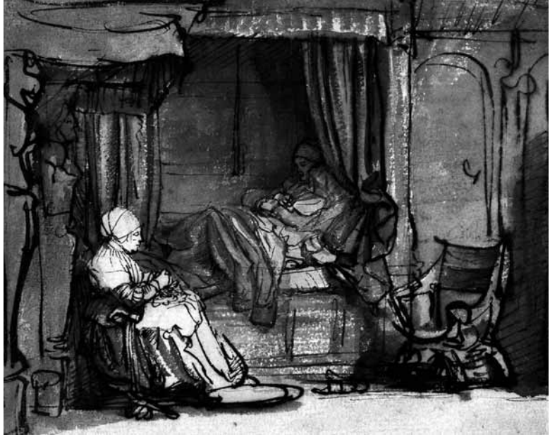
Rembrandt Harmensz. van Rijn, Interieur met Saskia in bed , pen in bruin, gewassen in grijs en bruin, 142 x 177 mm, Foto Fondation Custodia, Collectie Frits Lugt, Parijs.

Bij zijn aankopen maakte Lugt duidelijke keuzes wat betreft kunstenaar en thematiek. In maniëristische grafiek met wulpse godennaakten was hij bijvoorbeeld niet geïnteresseerd, wel in landschappen en portretten. Maar alles wat hij aankocht, demonstreert zijn werkelijk verbluffende oog voor kwaliteit. En hoewel hij vond dat kunst in de eerste plaats vanuit gevoel en ouderwets “kennerschap” benaderd moest worden, wist hij heel goed hoe belangrijk kunsthistorische kennis en een goede documentatie zijn. Hij publiceerde verschillende boeken die nog steeds standaardwerken zijn, zoals zijn catalogi van de Hollandse en Vlaamse tekeningen in Parijse openbare verzamelingen, een overzicht van veilingcatalogi (het Répertoire des catalogues de ventes publiques ) en een overzicht van verzamelaarsmerken op tekeningen en prenten ( Les Marques de Collections de dessins et d'estampes ), dat nu ook digitaal beschikbaar is en waaraan nog steeds wordt gewerkt. Desondanks weigerde hij in 1947 een eredoctoraat van de Universiteit van Amsterdam. In een uitgebreide brief aan de universiteit gaf hij daarvoor argumenten, zoals