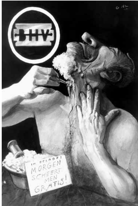
GAL-tekening over politicus Yves Leterme en de kieskring Brussel-Halle-Vilvoorde © GAL / Van Halewyck.

gekleurd, soms zelfs apocalyptisch ( Knack ). Zijn de tekeningen uit de jaren zestig nog (politieke) cartoons te noemen, later worden het waarachtige composities waar de lezer een tijdlang zoet mee is. Eén factor blijft constant: de woede, de walging, de verontwaardiging van GAL. Want ook al mag hij het prototype van de zachte, progressieve intellectueel zijn, de tekenaar verandert wanneer hij zijn pen ter hand neemt in een soort Wreker. Hij legt met pijnlijke precisie de vinger op de wonde, of, wat vaker gebeurt, draait het mes nog eens goed in dezelfde wonde en giet er een scheut vitriool over. En reden tot woede, walging en verontwaardiging is er te over. Van Leuven Vlaams, de verzuiling, de paus, de vrouw en de pil, de apartheid, het Midden-Oosten, de Berlijnse Muur, de bewapeningswedloop, de bekrompenheid van de Belgische politiek, de komst van de commerciële televisiezender VTM, Zwarte Zondag waarbij het Vlaams Blok plots een significant aantal stemmen haalt en het gekrakeel over de kieskring Brussel-Halle-Vilvoorde tot het islamfundamentalisme, Congo, de rioolpers, de euro, Bart De Wever en de opwarming van de aarde. Het is verbluffend