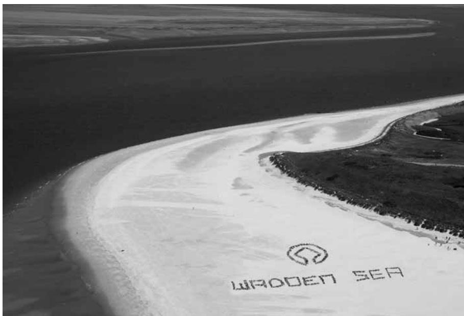
Kinderen beelden op het strand van Texel het Werelderfgoedlogo uit en vieren zo de erkenning van de Waddenzee door Unesco als Werelderfgoed, Foto P. de Vries / © UNESCO.