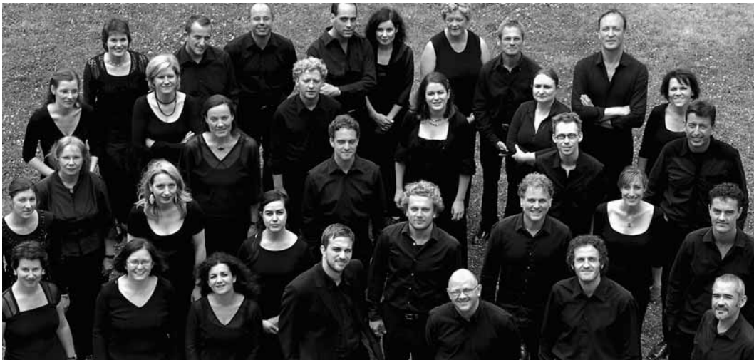
Collegium Vocale uit Gent, Foto Michel Garnier.

Nog een hoogtepunt kwam er overigens naar aanleiding van dit project: midden jaren zeventig vroeg Harnoncourt de Gentenaars om het eerste koor te verzorgen in Bachs Mattheuspassie, die hij in het Amsterdamse Concertgebouw zou uitvoeren