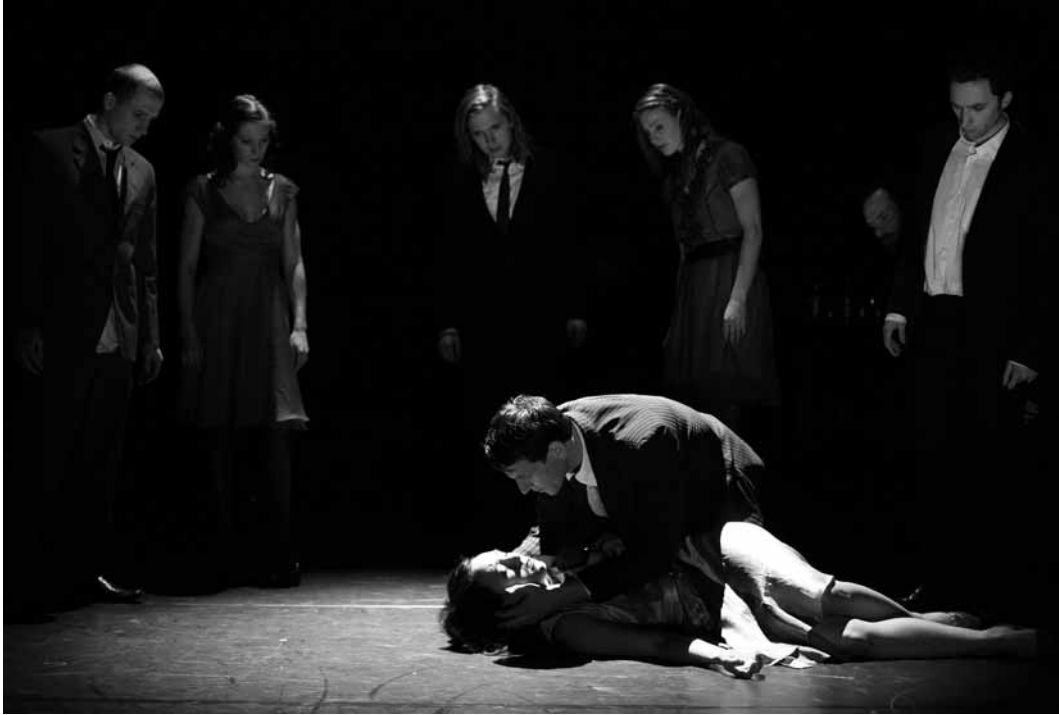
Innenschau , een voorstelling van Jakop Ahlbom uit 2010, Foto Stephan van Hesteren.

te puzzelen, zelf detective te zijn.” ( TM/TiN , jg. 14, 2010, nr. 1)