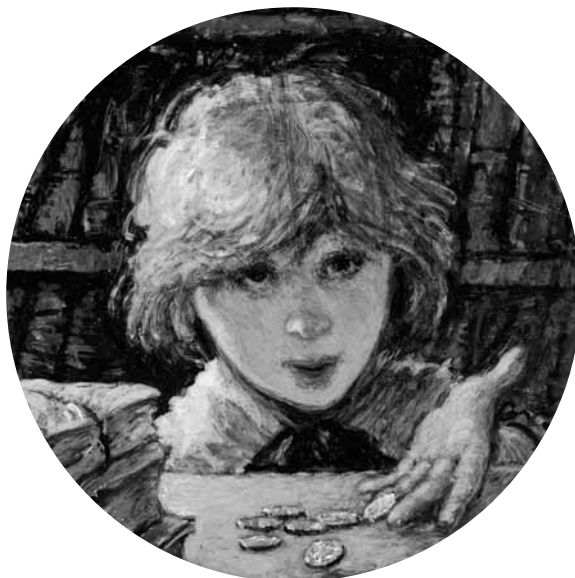
Afbeelding uit Jan Kruis' verstripping van Multatuli's Woutertje Pieterse

Later zette Kruis zijn opleiding voort aan de Rotterdamse Academie van Beeldende Kunsten en Technische Wetenschappen (nu de Willem de Kooning Academie), waar hij voor het eerst in aanraking kwam met het begrip kunst en de (Nederlandse) grootmeesters van de schilderkunst.