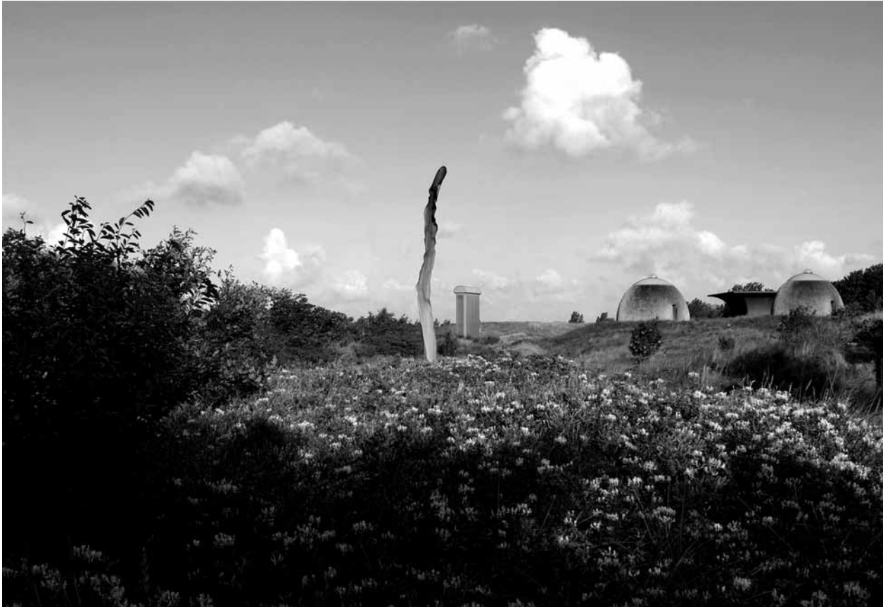
R.W. Van de Wint, De Nollen , Foto Stichting de Nollen / Hendriktje Ruiter.