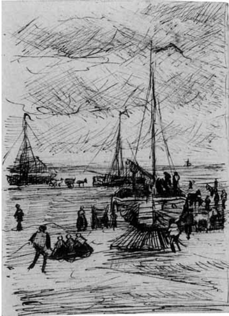
Vincent van Gogh, Zicht op het strand van Scheveningen , uit: Brief aan Theo van Gogh, Den Haag, 3 september 1882.