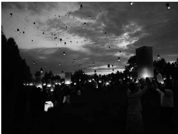
Watou 2009.

Watou 2009 – Tussen Taal en Beeld — VERZAMELDE VERHALEN #01 liep van 4 juli tot en met 6 september 2009. Over Watou 2010 was bij het ter perse gaan nog geen nieuws bekend.