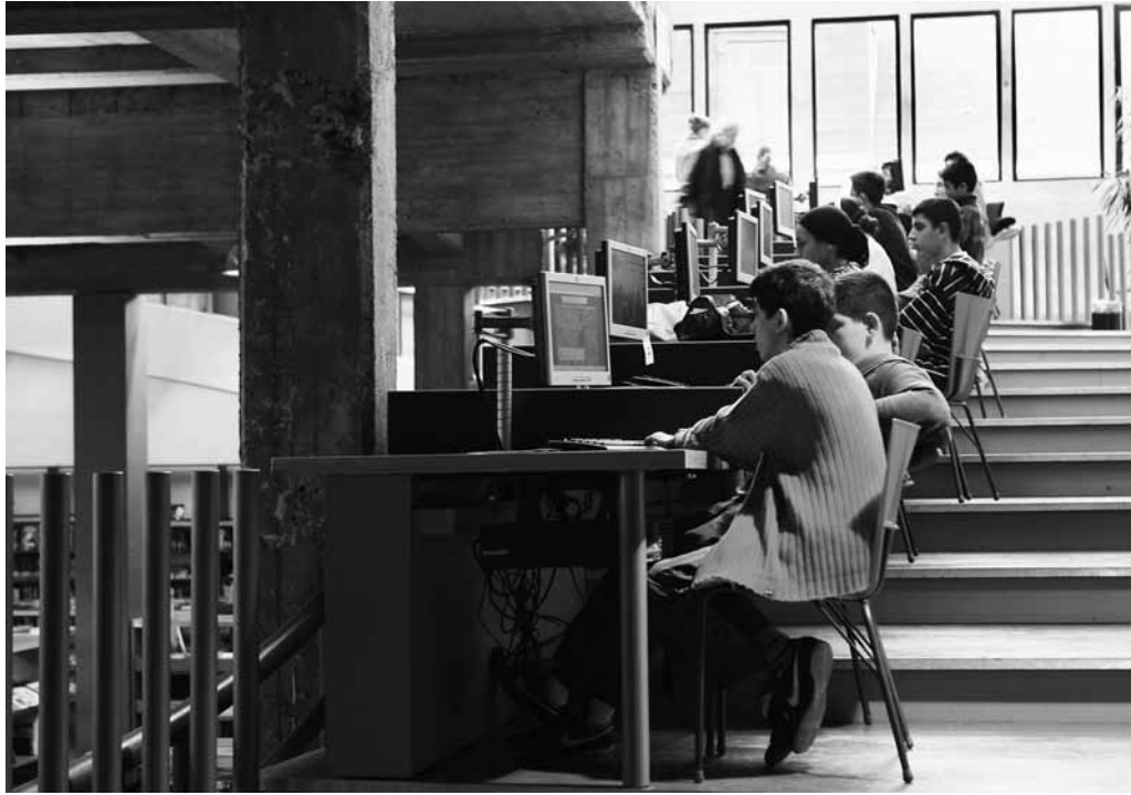
De “cyberhelling” in de Antwerpse Permekebibliotheek, Foto copyright Permekebibliotheek.

waar tal van zaken kunnen maar niet hoeven. De bibliotheek is een rustpunt geworden in een wereld waar thuis, werk of school steeds drukker zijn. Een plek die sociaal en gezellig is, ook al wissel je met niemand een woord. Tevens is de bieb in veel wijken en kleine woonkernen een van de laatste dynamische ontmoetingsplekken die de buurt levend helpen te houden.