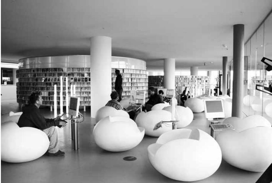
Multimedia in de Openbare Bibliotheek Amsterdam (OBA), Foto Annetje van Praag.