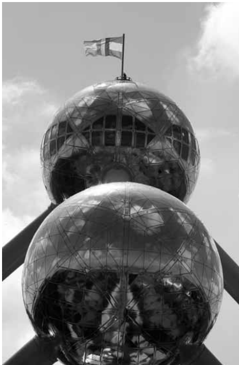
Op 5 en 6 juli 2008 vond in het Atomium te Brussel het Beneluxweekend plaats. Ter gelegenheid daarvan waren de vlaggen van de drie lidstaten gehesen op de hoogste bol van het Atomium, Foto Secretariaat-Generaal Benelux, Brussel.