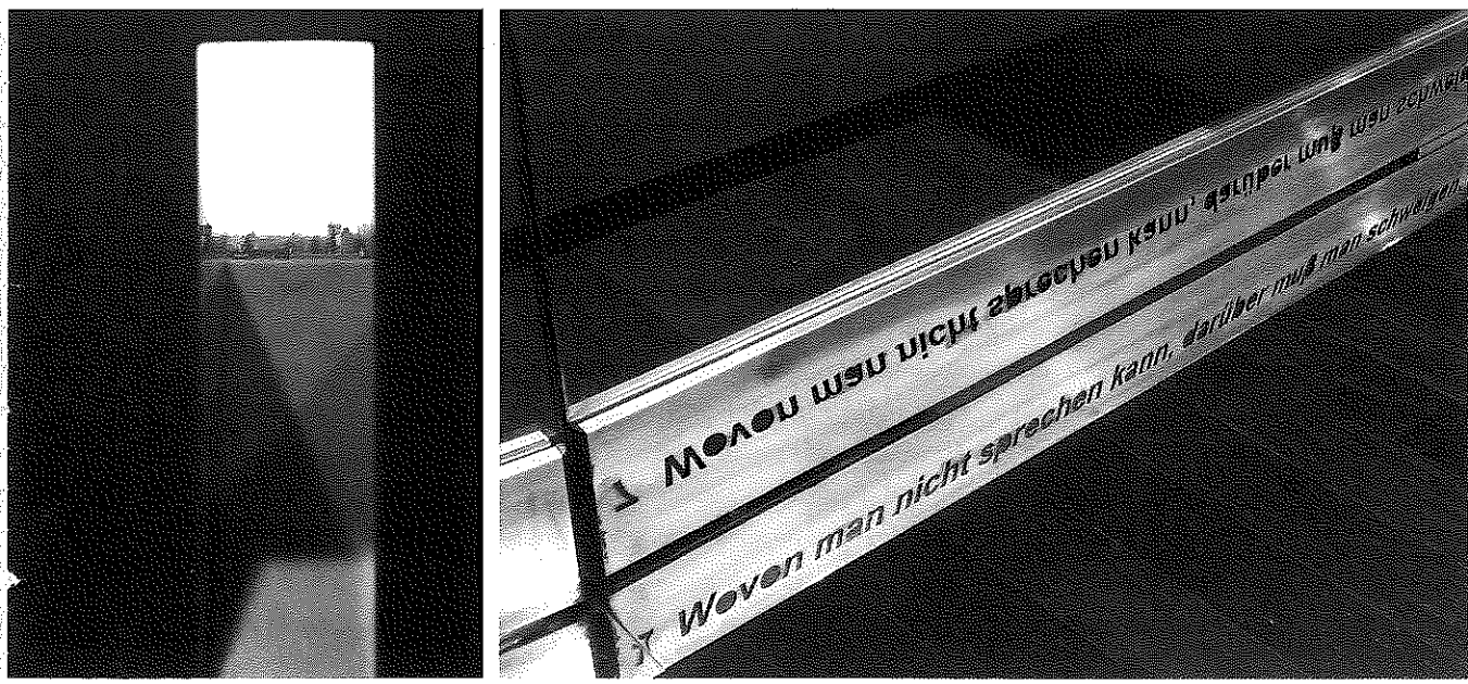
Koen Deprez, Het denkbare huis , Izegem, Foto Vercruyse & Dujardin.