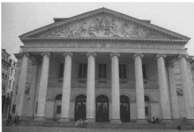
Het Muntplein met de Muntshouwburg, waar in 1830 de Belgische Revolutie uitbrak na een opvoering van „De stomme van Portici” – Foto Myriam Lemmens.

Wie een dergelijke hoop zou koesteren, zal mijns inziens bedrogen uitkomen. Het relatieve succes van degelijke populair-wetenschappelijke boeken over het Belgische nationale verleden heeft minder te maken met een hernieuwd nationalisme dan met een algemenere hang naar het verleden, die momenteel in de gehele westerse wereld wordt vastgesteld. Binnen die conjunctuur blijkt zowat elke herdenking goed om de dorst naar het verleden te lessen. Daarbij wordt in het verleden niet langer in de eerste plaats naar identificatie of naar morele lessen gezocht — alleen de geschiedenis van de judeocide lijkt zich nog tot die laatste functie te lenen — maar veeleer naar een kortstondige en dus ook vrijblijvende ontsnapping uit het heden. De onderwerpen die zich daartoe lenen, zijn bij voorkeur relatief eenvoudig en weinig bedreigend. Als we al iets kunnen afleiden uit het actuele succes van de Belgische