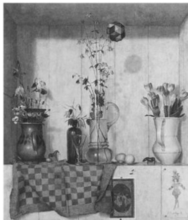
Matthijs Röling, „Lente”, 1975, olie op doek, 90,5 x 80,5 cm, collectie ING Kunstcollectie.

Waar vandaag de dag de figuratieve kunst meer en meer wordt gemusealiseerd — de expositie van Röling in het Drents Museum in Assen is de zevende in een reeks en het particuliere Frisia Museum in Spanbroek mikt geheel op deze stroming — was dat 25 jaar geleden wel anders. Tegen alle tendensen in be-