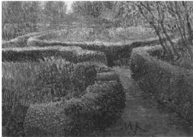
Matthijs Röling, „Tuin in Ezinge in oktober”, 2002, olie op paneel, 21 x 40 cm, particuliere collectie © Art Revisited.

De onderwerpkeuze is al net zo gevarieerd als de technische behandeling. Veel naakt, (intieme) portretten, maar ook het stilleven heeft hij uitgewerkt. Een wonderschoon paneeltje is niet meer dan een klein plankje met daarop een scherf en een glanzend kevertje tegen een witte doorleefde achtergrond. Daar staan de typische kastjes tegenover, waarmee Röling