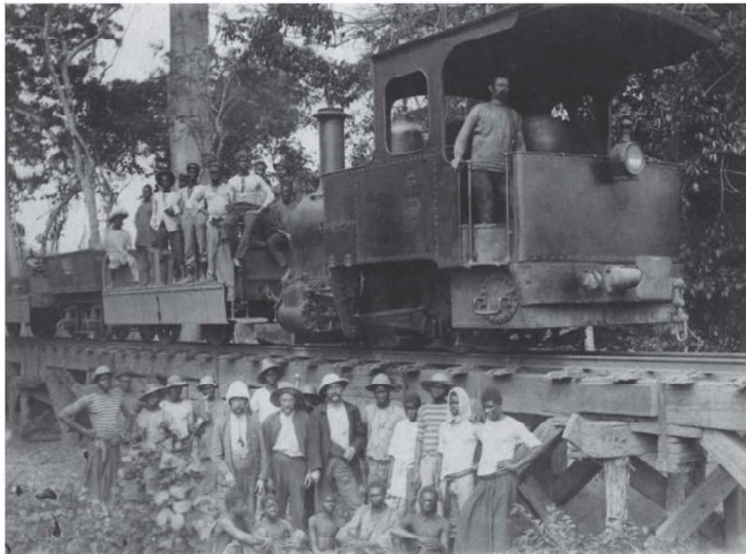
De aanleg van de spoorlijn Matadi-Leopoldstad (de voorlopige brug over de Kenge), 1894

oorspronkelijke museumgebouw, waar nu enkele wetenschappelijke diensten zijn ondergebracht, deed van 1898 tot 1908 dienst als eerste permanent Congomuseum van België. Pas nadien werd het huidige museum opgericht in het kader van de wereldtentoonstelling van 1910. De expo vormde een essentieel onderdeel van een machtige propagandamachine die de kolonie beter bekend moest maken bij de Belgen en bij mogelijke investeerders. Bij de wereldtentoonstellingen van 1897 en 1910 werden enkel de positieve verwezenlijkingen van de kolonisatie en de mission civilisatrice in de schijnwerpers geplaatst. Negatieve aspecten en sporen van geweld werden niet getoond. Een euvel dat de permanente expositie trouwens tot lang in de twintigste eeuw vertoonde.