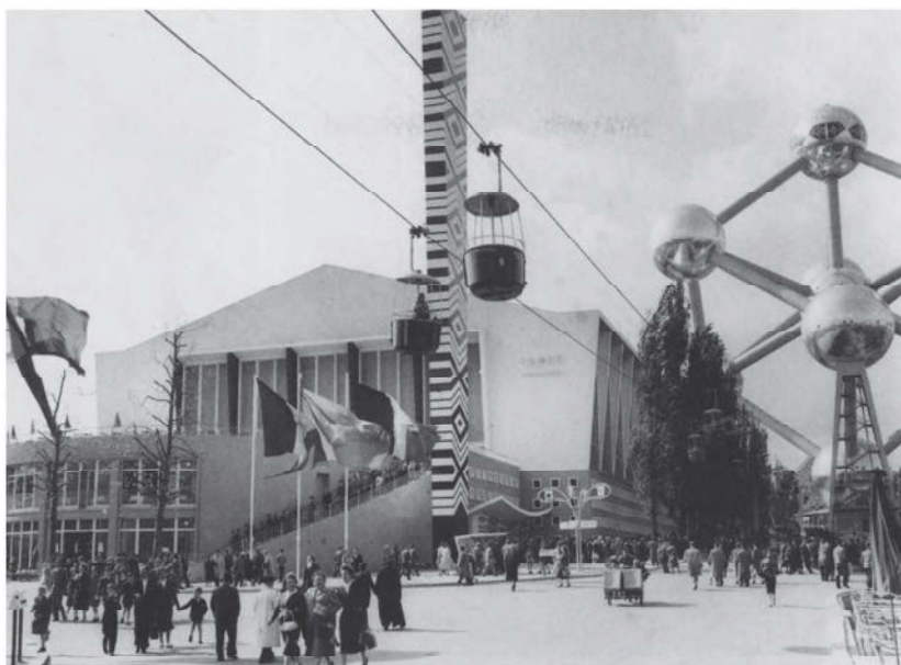
Het Groot Paleis van Belgisch-Congo en Ruanda-Urundi op de wereldtentoonstelling in Brussel van 1958 – Foto R. Stalin / KMMA Geschiedenis .