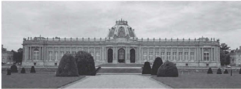
Het Koninklijk Museum voor Midden-Afrika in Tervuren