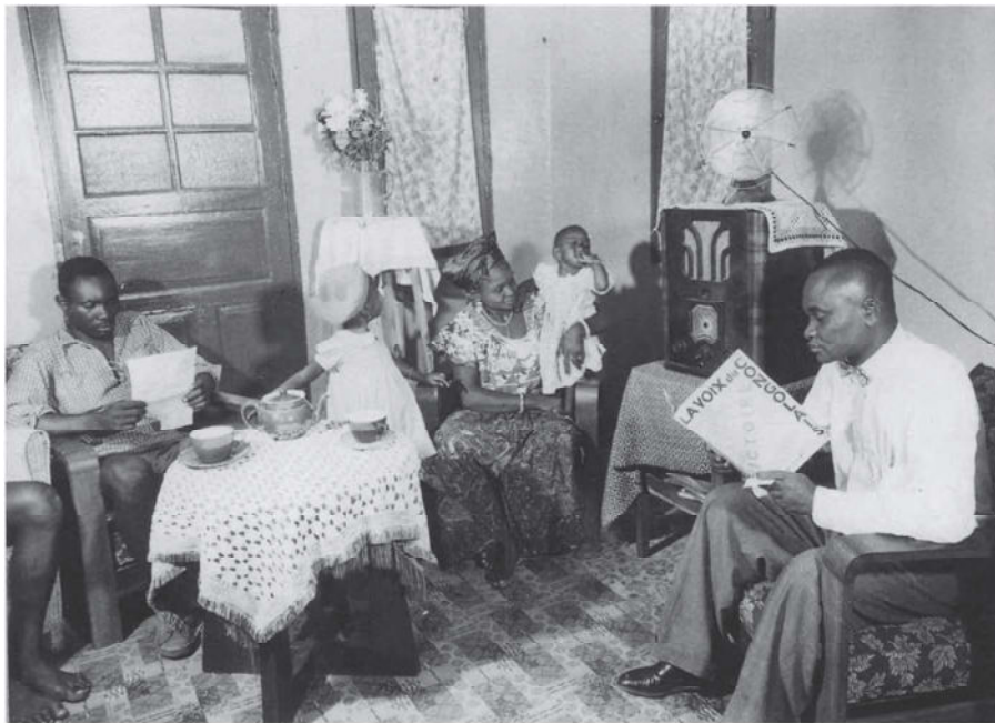
Een gezin van „évolués” in Leopoldstad, Belgisch-Congo, 1952 - Foto C. Lamote / KMMA Geschiedenis .