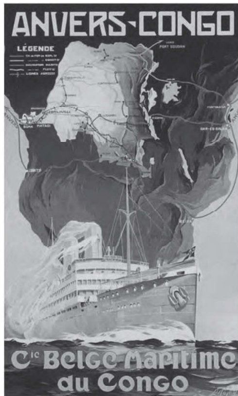
„Antwerpen-Congo”, Affiche Belgische Scheepvaartmaatschappij van Congo Stockmans en Co, Antwerpen, ongedateerd – KMMA Geschiedenis .

curatoren en bezoekers meekijken en nagaan hoe Congo werd gerepresenteerd. Het werd ook stilaan duidelijk dat de tentoonstelling niet enkel een al dan niet getrouw beeld van de „andere” cultuur schetst, maar ook veel vertelt over de „eigen” cultuur. De overdreven aandacht voor wapens bijvoorbeeld zegt misschien evenveel over Europa als over Afrika, en misschien wel meer.