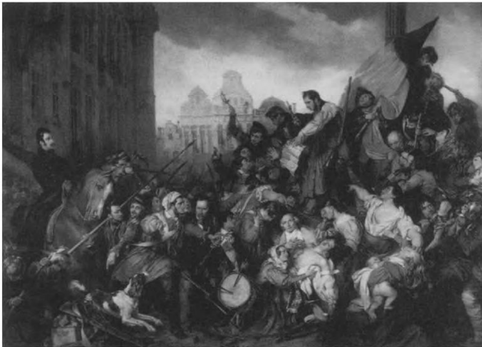
Gustaaf Wappers, „Tafereel van de septemberdagen van 1830 op de Grote Markt van Brussel”, 1835

gezag en een zelfstandige bestuursorganisatie die zich opwierp als legitieme vertegenwoordiger van de zuidelijke gewesten. En die ontwikkeling was mogelijk door de situatie dat de grote mogendheden, die in 1814-1815 het Verenigd Koninkrijk hadden opgezet, tijdelijk niet in de gelegenheid waren eensgezind op te treden en hun strategische schepping in stand te houden. Door deze samenloop van omstandigheden liep een stedelijke revolutie, die voorkomen, tijdig onderdrukt of anders opgelost had kunnen worden, uit op een volledige breuk van het koninkrijk in een noordelijk en een zuidelijk deel, en op de vorming van een zelfstandige Belgische staat. Dat resultaat was voor 1830 door nagenoeg geen van de oppositiegroepen voorzien of beoogd.