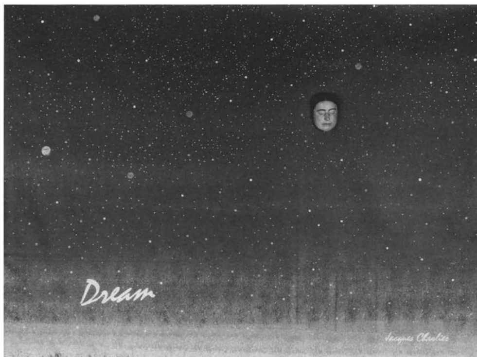
Jacques Charlier, „Dream”, 2004, collectie van de kunstenaar (uit de tentoonstelling „Visionair België”).

Republiek der Verenigde Nederlanden is in Europa ruim twee eeuwen lang een staatkundige anomalie geweest en tegelijk een van de succesrijkste staten. Een aantal van de Napoleontische constructiestaten en het voorbeeld van Pruisen, Duitsland en Italië tonen dat ook zulke constructies kunnen uitgroeien tot erkende natiestaten. In de Amerikaanse Burgeroorlog stonden twee modellen van nationaliteit tegenover elkaar. Het unionisme dat overwon was geenszins natuurlijker dan de eis van de zuidelijke staten dat hun recht op „nationale” autonomie gerespecteerd zou worden.