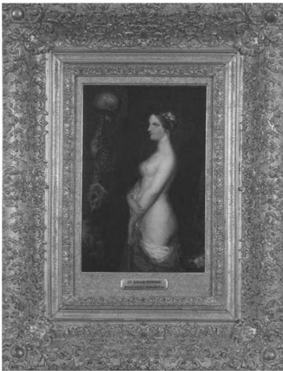
Antoine Wiertz, „De mooie Rosine”, ca. 1848, privé-verzameling (uit de tentoonstelling „Visionair België”).

autocratische bestuursstijl was weinig geschikt om de zuidelijke elites en de katholieke kerkorganisatie voor zijn project te winnen. Zijn verlicht-autoritaire onderwijs- en kerkpolitiek botsten hard met de machtsambities van de katholieke kerkleiders.