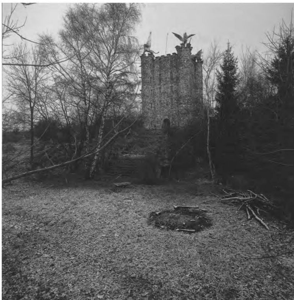
Toren van Eben-Ezer, plaats voor vrede en verdraagzaamheid tussen de volkeren, Eben-Emael, vuursteenmuseum (uit de tentoonstelling „Visionair België”) – Foto Harald Szeemann.

Economisch waren die mogelijkheden er zeker. Ondanks de aanvankelijke belangentegenstellingen tussen de protectionistische wensen van het meer geïndustrialiseerde Zuiden en de vrijhandelwensen van het maritiem-commerciële Holland creëerde de mercantilistische politiek van Willem I met behulp van de Indische koloniën een economisch geheel dat bedoelde zowel de zuidelijke nijverheid als de Hollandse handel voordeel te brengen. En hoewel de infrastructurele investeringen meer aan het Noorden dan aan het Zuiden ten goede kwamen en de ondoorzichtigheid en eigengereidheid van Willems financiële beleid niet het gewenste vertrouwen schiepen, is het historische oordeel toch dat de economische politiek een van de meer geslaagde aspecten van het unificatiebeleid vormde. De koning heeft belangrijke kansen laten liggen, maar de mislukking van het natievormingsproces lag niet op financieel-economisch vlak. (15)