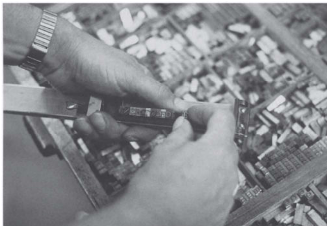
Een handzetter plaatst letters in een zethaak — Foto Jos A.A.M. Biemans.

Dat van een dergelijke geschiedenis hier geen sprake is, heeft echter niet met onwil te maken, integendeel. Een Vlaams-Nederlandse samenwerking lag juist aan de basis van wat uiteindelijk zou resulteren in Bibliopolis . In de jaren negentig vatten wetenschappers uit Nederland en België het plan op om samen een geschiedenis van het boek te schrijven. Volgens Paul G. Hoftijzer, hoogleraar boekwetenschap aan de Universiteit Leiden en een van de toenmalige initiatiefnemers, „strandde het project op zijn eigen ambitie, maar ook wel een beetje op de bureaucratie van beide nationale onderzoeksorganisaties” (citaat uit een lezing van 1 april 2004 te