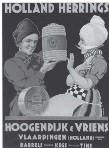
Affiche voor Hollandse haringen, 1930

België in verschillende kampen terecht: België in dat van de Franse Revolutie, Nederland in dat van de Duitse romantiek. Het paradoxale is dat beide landen werden uiteengedreven door hun vereniging, in 1815, in het koninkrijk dat Willem I bestuurde naar het voorbeeld van zijn Pruisische verwanten. (2)