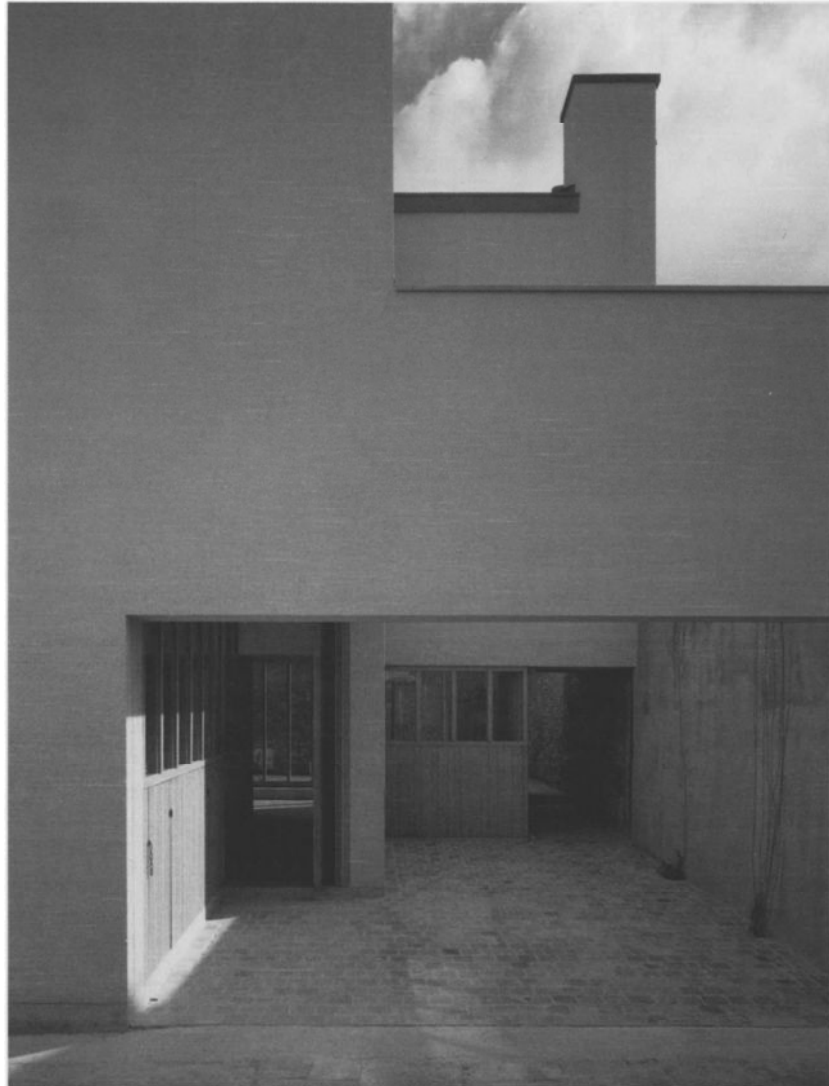
Woning Leeuws-Croes te Gent

in alle woningontwerpen zijn ze het structurerende principe van de plattegrond.