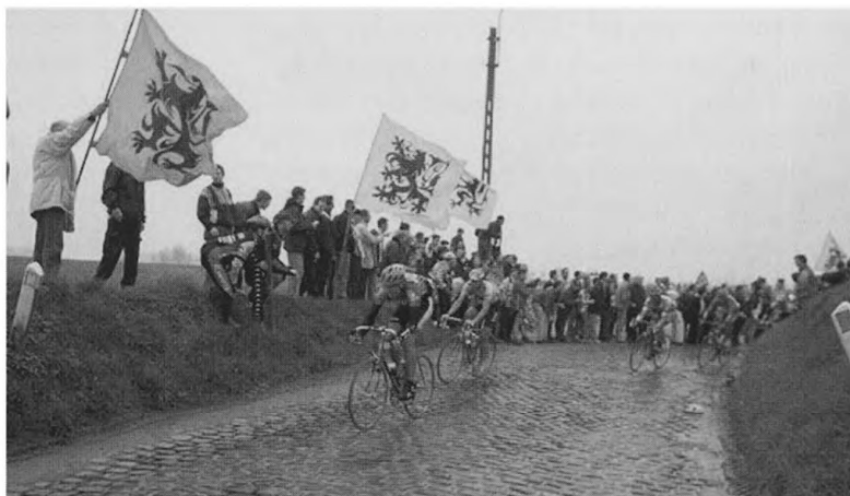
De Ronde van Vlaanderen, editie 1999.

In zowat alle recente publicaties over „1302” wordt, deels omdat er over de „feiten zelf” betrekkelijk weinig nieuws te melden is, de nadruk gelegd op (het belang van) de context. Daarbij gaat het, zoals bij Despriet, in de eerste plaats om de Franse-Vlaamse oorlog waarvan de Slag bij Kortrijk (slechts) een moment was, maar verder ook om alle aspecten van de maatschappij waarin dit gebeuren zich heeft voorgedaan. Zoals de titel - Omtrent 1302 - aangeeft, gaat het collectieve werk, dat onder leiding van Trio, Heirbaut en Van den Auweele werd gepubliceerd, niet zozeer over de gebeurtenissen van 11 juli 1302 zelf. Met bijdragen van onder meer Jan Dumolyn, Peter Stabel, Véronique Lambert en Randall Lesaffer ligt de nadruk veeleer op staatsrechtelijke discussies, sociale ontwikkelingen, politieke verhoudingen en economische omstandigheden van de periode „rond 1300”. Die kunnen immers verklaringen aanreiken voor de (uitzonderlijke) gebeurtenissen én voor de gevolgen die ze hebben gehad. In 1302: feiten en mythen van de Guldensporenslag worden amper vijftien bladzijden vrijgemaakt voor het hoofdstuk dat „De Guldensporenslag” heet. Zij worden gevolgd door veel langere artikelen van Marc Boone, Eric Bournazel en Dirk Heirbaut waarin de stedelijke organisatie, de toenmalige opvattingen van het koningschap en de instellingen en het recht in het Vlaanderen van omstreeks 1302 uitgebreid en genuanceerd worden behandeld. Zij maken duidelijk hoe de