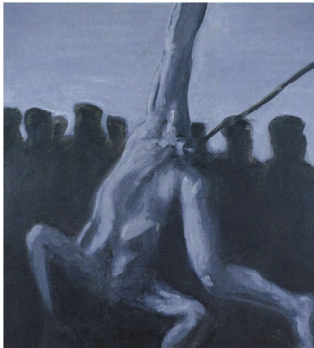
Jan van Imschoot, „Human Humiliation”, 1996, 75 x 65 cm, private collectie Antwerpen

gefantaseerde voorstelling en geen werkelijkheid. Dat raster heeft hij geleidelijk achterwege gelaten en vervangen door de scènes op een manier te schilderen die afstandelijkheid beoogt. Na een tijd doken naast het hoofdmotief ook woorden of tekstflarden op om een vervreemdend effect te bereiken en soms durft hij de geschilderde voorstelling achteraf nog met opzichtige houtskooltrekken te bewerken. Hij benadert zijn thema's nu ook op een systematischer manier. Waar hij zich vroeger over een onderwerp documenteerde, waarna vervolgens een schilderij tot stand kwam, schildert Van Imschoot nu reeksen waarin hij het thema telkens vanuit een andere hoek benadert. „Zoals je een boek zou maken met twintig hoofdstukken”, zegt hij. Enkele maanden geleden was hij volop bezig aan een dergelijke uitgebreide reeks die naar eigen zeggen met het Vlaams Blok te maken had. Toch was er geen direct verband tussen de omstreden partij en de reeks doeken die in zijn atelier in de maak was. Het was de schilder er veeleer om te doen een bekrompen, benauwde Vlaamse sfeer weer te geven waarin het gedachtegoed van het Blok gedijt. Welke schilderijen uit de reeks uiteindelijk zouden overleven, was toen nog niet duidelijk. De doeken die hij als mislukt beschouwt, gaan er onverbiddelijk uit. Vandaag blijkt dat hij het onderwerp nog heeft verbreed. „Het gaat bijvoorbeeld ook over verveling, de verveling die je bijvoorbeeld in een lange lege zieken-