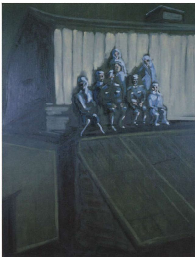
Jan van Imschoot, „Siberian Sunrays” 1996, 130 x 100 cm, private collectie Gent - Foto Frederik Lievens.

huisgang overvalt en waardoor je de tegels gaat tellen. Enkele schilderijen van lege ruimtes hebben met dat gevoel te maken.”