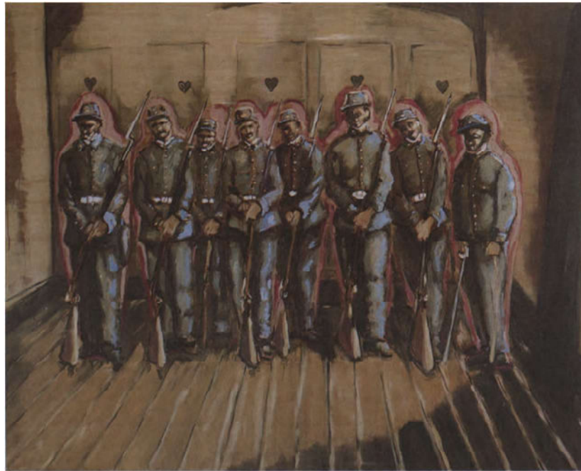
Jan van Imschoot, „Réconstruction d'une exécution / Les Sans-patiences”, 1997, 120 x 160 cm, collectie BACOB - Foto Frederik Lievens.

eens een rol. Bijvoorbeeld als je een verkeerde borstel gebruikt en rode in plaats van groene verf opbrengt.”