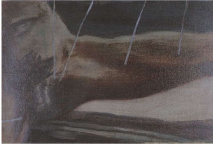
Jan van Imschoot, „Male Landscape I”, 1993, 40 x 60 cm, private collectie Gentbrugge - Foto Kristin Daem.

De manier van schilderen, kan echter niet worden losgekoppeld van de inhoud van de voorstelling: de broeierige, mysterieuze spanning die uitgaat van het beeld wordt er door versterkt.