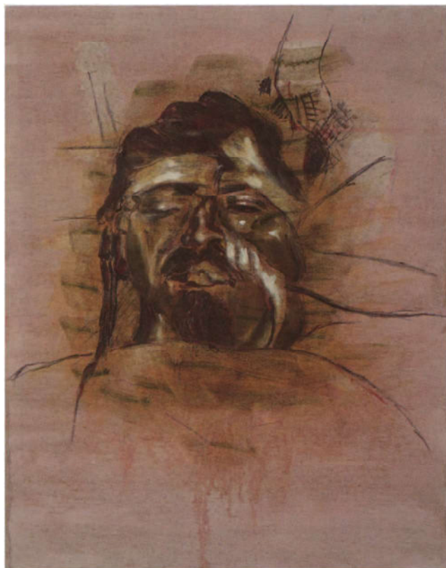
Jan van Imschoot, „The red dead of Lev Bronstein / the dogmatic heritage”, 1998, 100 x 80 cm private collectie Wetteren - Foto Dirk Pawwels.

steek is aan de verkeerde kant aangebracht. Bij navraag blijkt het beeld van deze blonde vrouw een detail uit een schilderij van een nazi-schilder te zijn. De tegenstelling tussen enerzijds de esthetiek en anderzijds het lijden dat erachter schuilt, houdt Jan van Imschoot al langer bezig. Dat intrigeert hem ook aan militaire kerkhoven: de wetenschap dat achter dat mooie regelmatige patroon van witte kruisjes op het groene parkgazon een waar slachtoffer ligt. Jan van Imschoots vele schilderijen van overleden mensen die opgebaard liggen in hun beste kleren, in een poging het rottingsproces nog even te maskeren, kunnen eveneens op die manier worden bekeken.