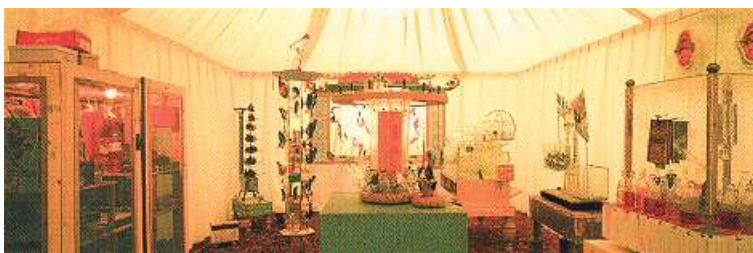
Patrick van Caeckenbergh, 'Het leven zelf', deel I: 'Ik sprak met viervoeters, vogels en vissen...': installatie in Kunsthalle Lophem (Brugge) in 1993 - Courtesy Zeno X Gallery - Foto Pjerpel Rubens.

Rogiers (zie Ons Erfdeel , nr. 1/2000), Wim Delvoye (zie Ons Erfdeel , nr.5/97) en Patrick van Caeckenbergh.