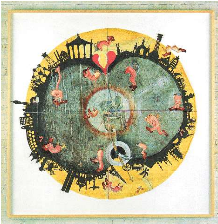
Patrick van Caekenbergh, 'Astronomie Pittoresque. Part II' (1996), 170 cm / kader 196 x 196 cm, mixed media (collage) - Courtesy Zeno X Gallery - Foto Felix Tirry.

'Het leven zelf' bestaat op zijn beurt uit verschillende fases, die allemaal luisteren naar sprookjesachtige titels. Deel I heet 'Ik sprak met viervoeters, vogels en vissen', waarbij de kunstenaar onderzoek deed naar de instinctieve gedragspatronen bij dieren. Hij stelde daarbij onder meer vast dat sommige basisbehoeftes van de mens een dierlijke, instinctieve oorsprong hebben en geneutraliseerd kunnen worden door hun energie om te buigen in de richting van nuttige, sociaal ongevaarlijke gedragspatronen.