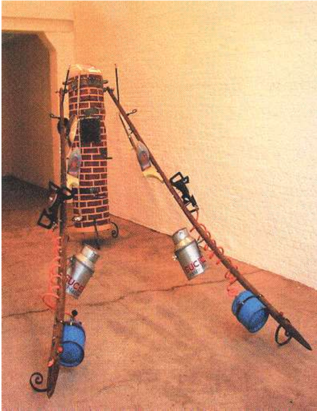
Patrick van Caekenbergh, 'Le confiturier', 1999, mixed media - Courtesy Zeno X Gallery.

essentieel denkbeeld: sinds de Verlichting is de mens koortsachtig op zoek naar ontwarring, ordening, oriëntatie, reglementering. Kortom: de Ratio overheerst. In die nieuwe wereld is almaar minder plaats voor fantasie, schijn, poëzie, halve waarheden. Precies dat doet Van Caekenbergh: zich bezig houden met het ogenschijnlijk petieterige en pietluttige.