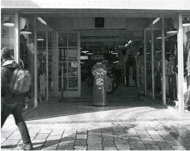
Het verdwijnen van de grens tussen interieur en exterieur. Veldstraat, Gent

situatie voor de fietser en de voetganger verbeterd. De wereldberoemde Graslei, zelf voor een stuk het resultaat van het musealiseringproces van de Wereldtentoonstelling begin deze eeuw, schittert in alle zuiverheid. Bij de heraanleg zijn het obligate potsierlijke stadsmeubilair en de kitscherige tegels gelukkig achterwege gebleven. Anderzijds doemt er dikwijls het beeld van een soort Bruges la morte op. De stedelijke vitaliteit en veelkleurigheid moeten vooral door het toerisme worden ingevuld. De marktkramers op de nabijgelegen Groentemarkt zijn verdwenen. Het Postgebouw van Louis Cloquet wordt omgebouwd tot een winkelcentrum. Wanneer je er 's avonds wandelt, weerklinken je eigen voetstappen.