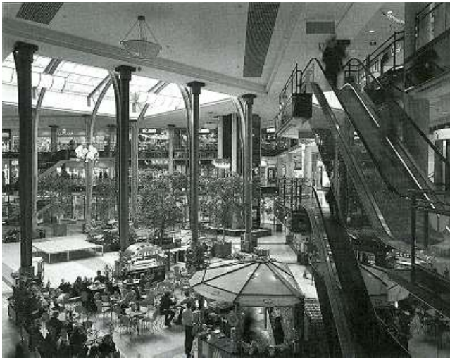
De mall als imitatie van de stad en vervolgens als stedenbouwkundig model. Shopping mall, Wilsonplein, Gent - Foto Hilde D'haeyere.

Omdat dit fenomeen zich het duidelijkst in de Verenigde Staten manifesteert, wordt er vaak opgemerkt dat het in Europa allemaal niet zo'n vaart loopt. Aan deze zijde van de oceaan zouden de historische steden immers een onwrikbare identiteit bezitten, die de decentralisatie en uitdunning van stedelijke functies verhindert. Hier wringt echter de schoen. Identiteit is, op zijn zachtst gezegd, een problematisch en glibberig begrip. In tegenstelling tot ansichtkaarten zijn steden voortdurend aan veranderingen onderhevig en hebben ze altijd bestaan bij gratie van contrasten en fricties. Precies omdat ook de Europese stad zijn economische, sociale of culturele betekenis ten dele heeft verloren, wordt zo sterk op haar (historische) identiteit terug gegrepen. De identiteit van een stad vastleggen is een handige retorische truc voor toeristische folders, maar kan ook de doodsteek betekenen voor het stedelijke leven. Het historische karakter van een stad, dat getuigenis aflegt van haar vroegere culturele rijkdom en gelaagdheid, wordt zo getransformeerd tot een bewijs van haar huidige monofunctioneel karakter. Het uitpakken met een stedelijk historisch karakter vormt dus niet zozeer een bewijs van het feit dat de stad weerwerk biedt tegen de logica van decentralisatie. Integendeel, het toont dikwijls aan dat de stad deze logica noodgedwongen heeft aanvaard en zich enkel nog als toeristische attractie weet staande te houden.