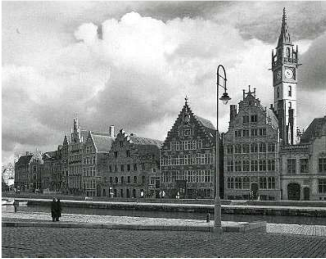
De herwaardering en musealisering van de historische stad. Heraanleg van de Graslei in Gent - Foto Hilde D'haeyere.