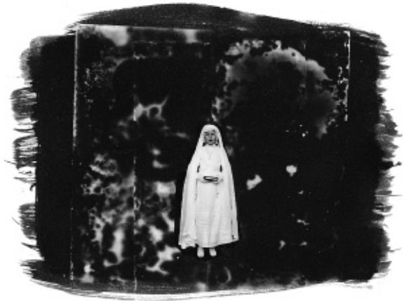
Roger Kockaerts, beeld van het recyclingproject, Brussel, 2006, courtesy of the artist, 15 x 20 cm, platina-palladiumdruk.

Omdat er in de jaren vijftig nauwelijks fotoscholen waren, sloot hij zich in 1957 aan bij de fotoclub van Bosvoorde. Hij kwam er terecht in hét broeinest van de subjectieve fotografie in België, het